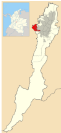
Imagen. No. 1F Ubicación de Zona Séptima- Bosa.

Bosa es la localidad séptima de Bogotá, ubicada en la zona suroccidental de Bogotá, se encuentra a los 4:47 grados de latitud norte y 74:11 de longitud al oeste del meridiano de Greenwich. La altura sobre el nivel del mar es 2590m con temperatura media de 14 grados centígrados. Dista del centro de Bogotá en 14 kilómetros. Su terreno es plano y por ella corre el Río Tunjuelo antes de desembocar en el río Bogotá, que también bordea a la localidad por el costado occidental. Limita con Fontibón y Kennedy al norte y al oriente con la localidad de ciudad Bolívar, por el sur limita con el municipio de Soacha.