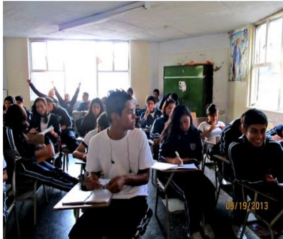
Imagen. Curso 10.02

En síntesis, es un curso muy interesante, por su buen nivel de trabajo, porque además de hacer, son proactivos, bastante inquietos en su actuación y su trabajo académico y gustan de proponer en el trabajo; con grandes capacidades para las danzas, el teatro y buenos activistas ambientales. Un curso heterogéneo en sus intereses y en su formación familiar, donde hay niños bastante introvertidos, pero con buen rendimiento académico y otro grupo de estudiantes extrovertidos, juguetones, con diversos desempeños académicos. Además son afectivos y en muchas ocasiones empáticos y solidarios, pero generadores de hechos de indisciplina que en muchas ocasiones han eclipsado sus logros y no se ha logrado consolidar como el grupo autónomo y líder que todos los docentes en el colegio estamos buscando.