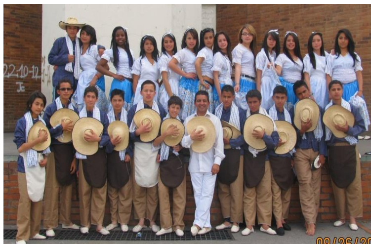
Grupo 10.02 en presentación de danzas..Tomadas por Wilson Páramo H.

En síntesis, es un curso muy interesante, por su buen nivel de trabajo, porque además de hacer, son proactivos, bastante inquietos en su actuación y su trabajo académico y gustan de proponer en el trabajo; con grandes capacidades para las danzas, el teatro y buenos activistas ambientales. Un curso heterogéneo en sus intereses y en su formación familiar, donde hay niños bastante introvertidos, pero con buen rendimiento académico y otro grupo de estudiantes extrovertidos, juguetones, con diversos desempeños académicos. Además son afectivos y en muchas ocasiones empáticos y solidarios, pero generadores de hechos de indisciplina que en muchas ocasiones han eclipsado sus logros y no se ha logrado consolidar como el grupo autónomo y líder que todos los docentes en el colegio estamos buscando.