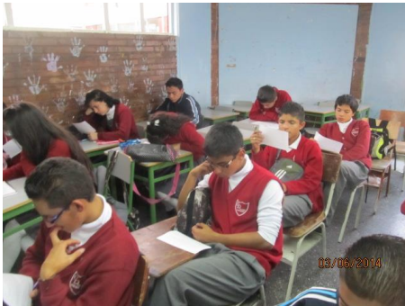
Ejercicios de lectura durante los talleres