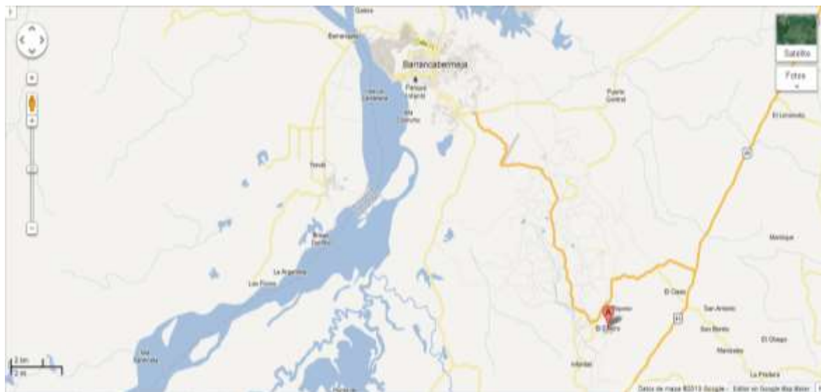
Ilustración 1: Ubicación corregimiento El Centro