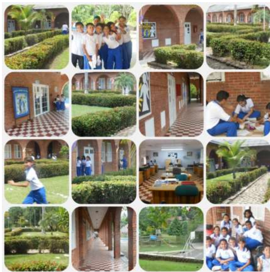
Ilustración 2: Espacios del colegio