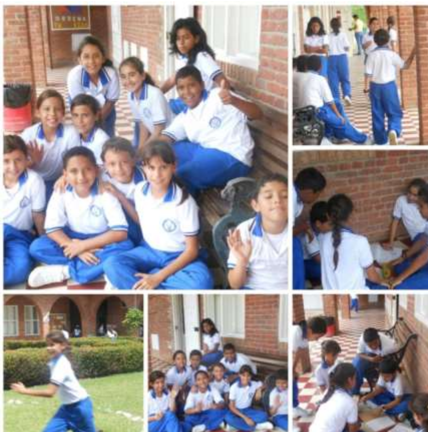
Ilustración 3: Grado Sexto A