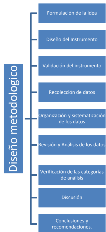
Figura 2 Procedimiento metodológico, del autor

Se dispuso para tal fin el siguiente procedimiento: