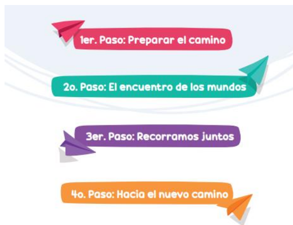
Ilustración 1: Etapas transición educativa