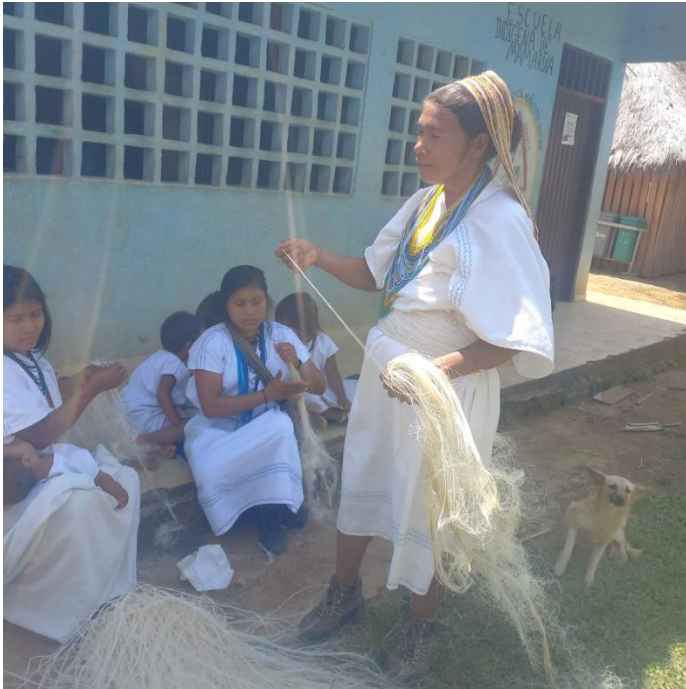
Integración de las madres de familia y estudiantes en las actividades de hilado y tejido del fique.