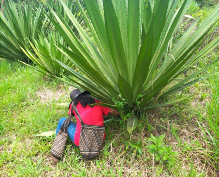
Plantas de fique-personas seleccionadas para arrancar la hoja. El docente seleccionando la planta de fique.

Imágenes de las distintas actividades y encuentros realizados a lo largo de todo el proceso.