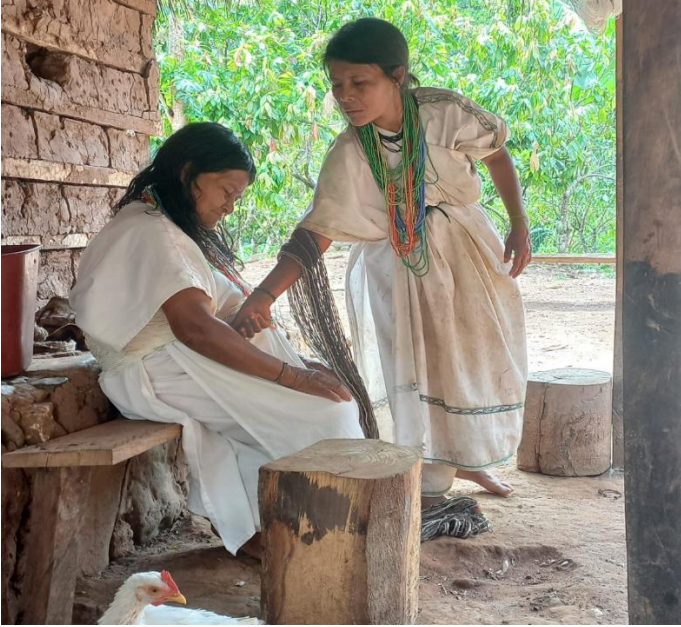
Madres de familia que dieron sus palabras de oponion ante las actividades realizadas.