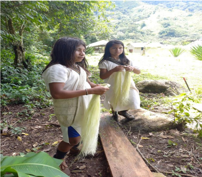
Hebras de fique escurridas, secas para organizar en cadejos.