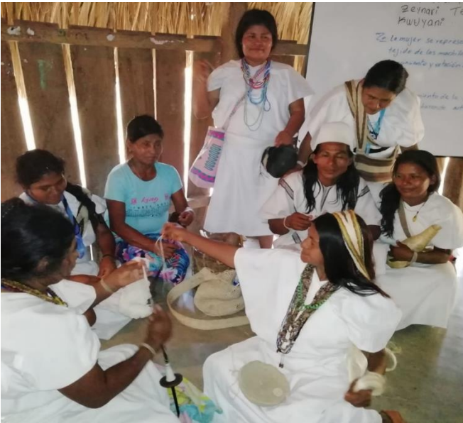
Actividad de participación de madres de familia para el desarrollo de tejidos.