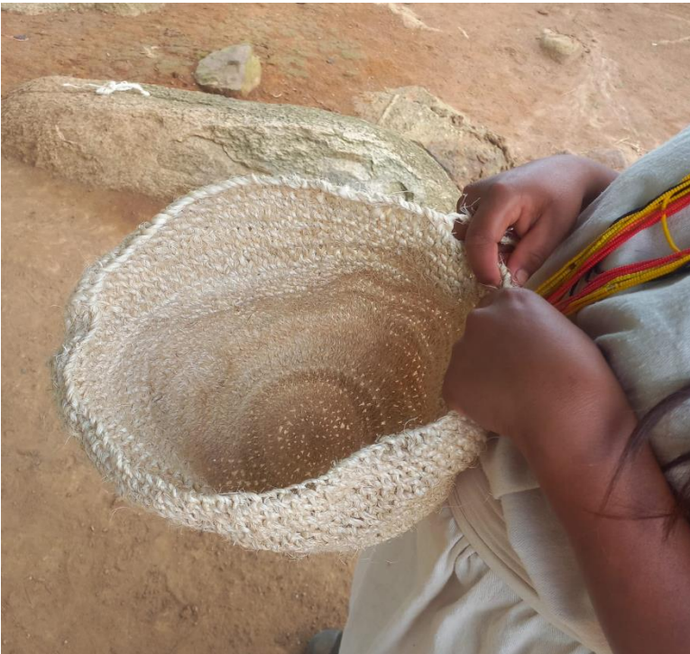
Tejido de una mochila de fique hecho por una estudiante.