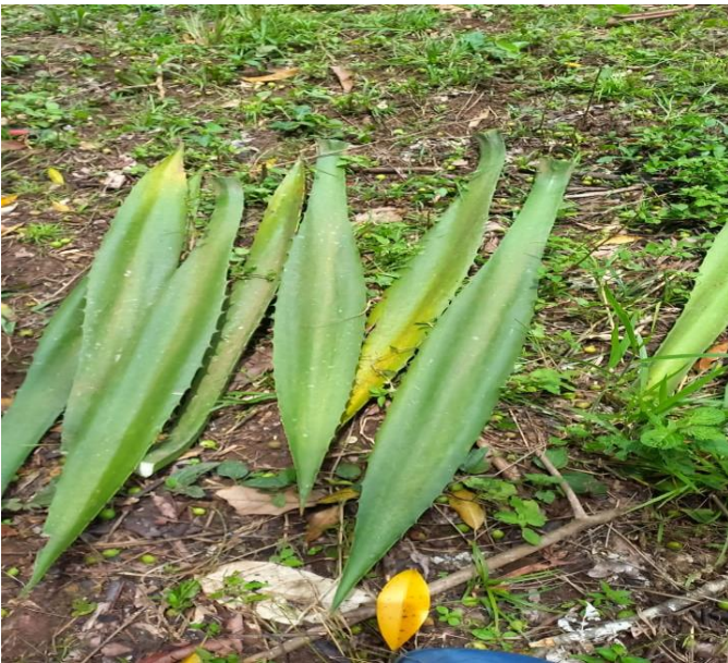
Hojas de fique dispuestas a ser desfibradas.