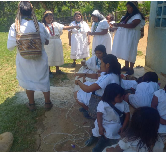
Madres de familia orientando a estudiantes para la hilada de los cadejos de fique.