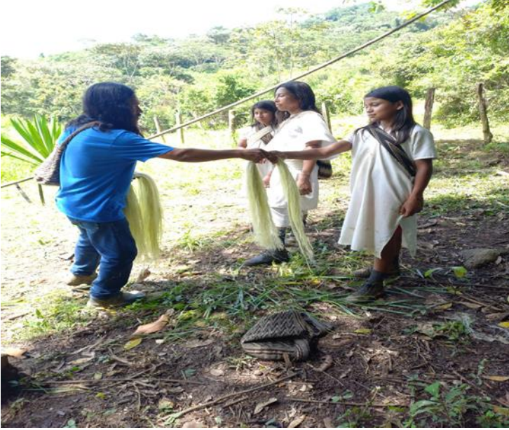
Diferentes cadejos de fique para organizar y empezar a hilar.