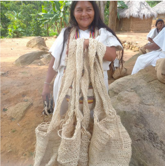
Diferentes mochilas y mochilones tejidos , ya terminados.