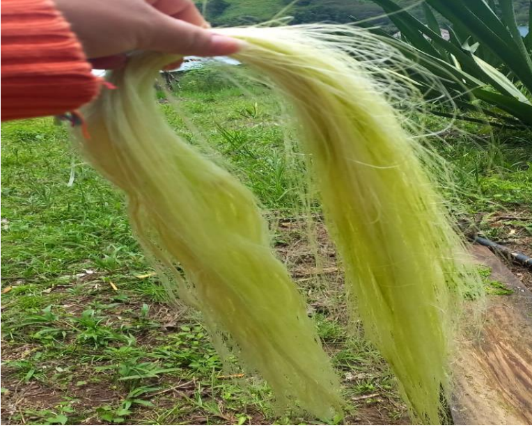
Hebras de fique extraídas.