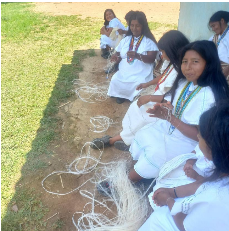
Madres de familia compartiendo con las estudiantes las actividades, se fortalecen los lazos de confianza y cohesión grupal.