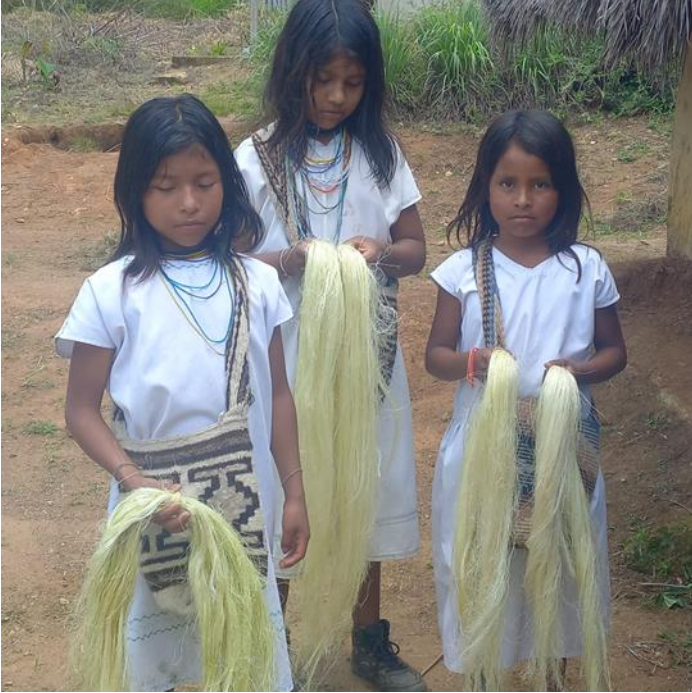
Niñas exponiendo las hebras largas de fique listas para hilar.