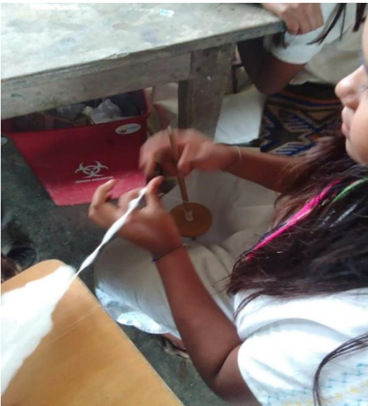
Estudiantes hilando con el huso.