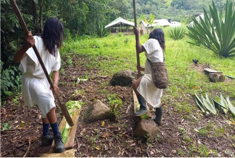
Proceso de desfibrar, la hebra de fique con la macana. (herramienta de corteza de tallo especial.)