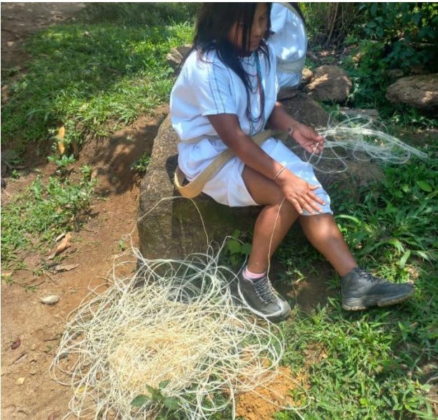
Estudiante arhuaca hilando fique en la pierna .