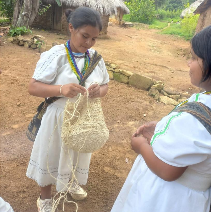
Estudiantes tejiendo una mochila grande de fique.