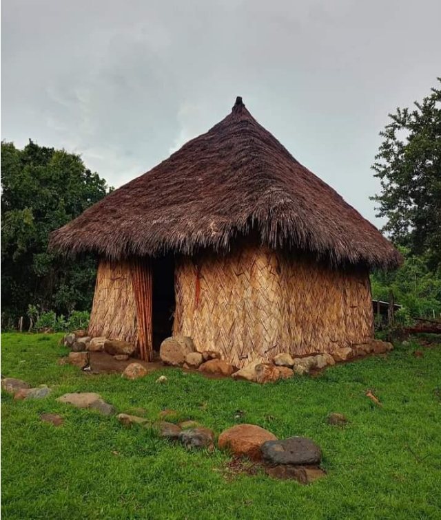
Kankurwa, lugar ceremonial para hacer los pagamentos espirituales.