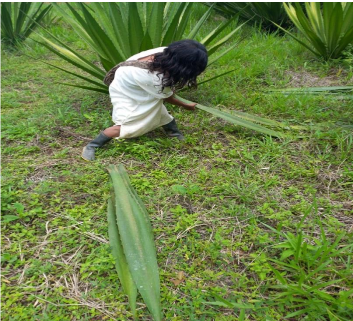
Personas designadas para extraer las hojas de fique.