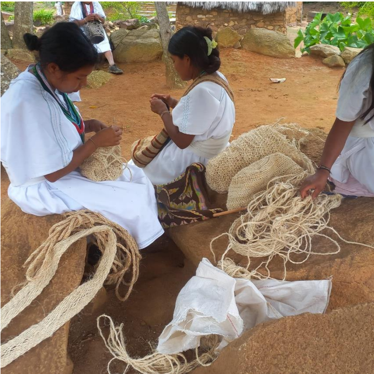
Mochilas y mochilones tejidos por los estudiantes y madres de familia.