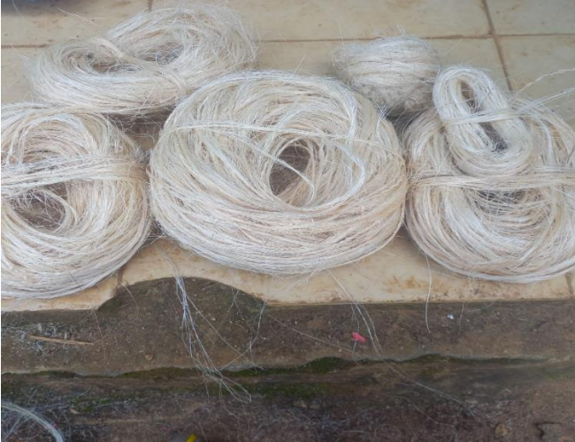
Cadejos de fique de diferentes tamaños.