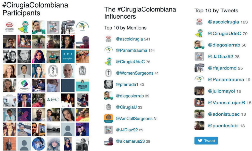
Figura 2. Ranking por categoría según participantes, menciones y número de tuits

Esta etiqueta también permitió la interacción entre los grupos quirúrgicos de diferentes regiones de Colombia, la participación de sus residentes en competencias fotográficas y la difusión de galardones y concursos. Al respecto, es interesante anotar que se ha descrito cómo la canalización de contenidos a través de una etiqueta común permite la interacción asincrónica de todos los participantes o interesados, rompiendo las barreras de comunicación entre los mismos 5 .