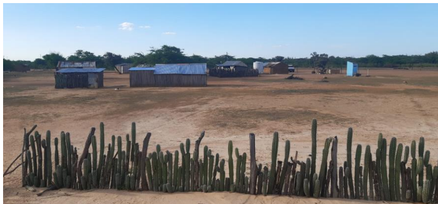
Ilustración 1. Instalaciones IEIR Media Luna Jawou

puedan manejar adecuadamente esta habilidad, permitiéndoles conocer su propia historia como pueblo indígena, como Wayúu y como individuos sociales.