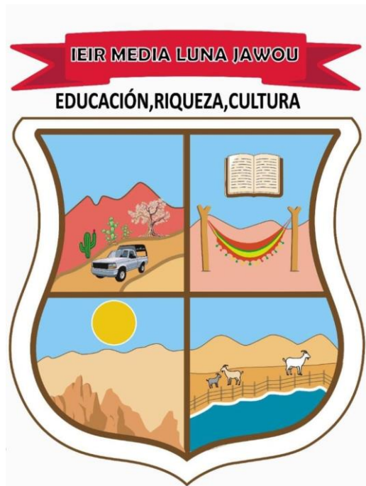
Figura 2. Escudo del CEIR