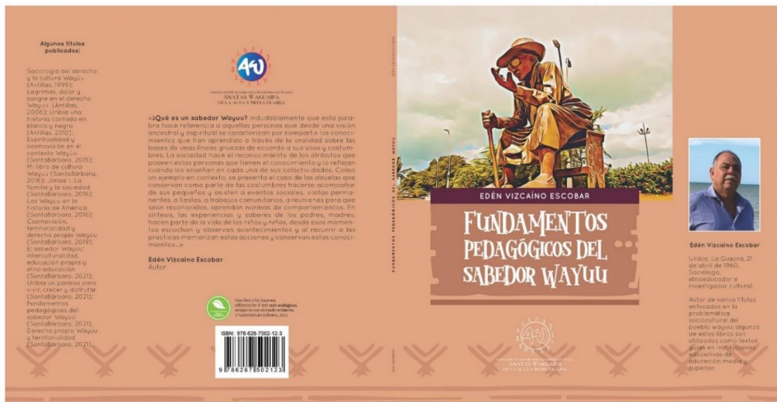
Figura 9. Cartilla Etnoeducativa escrita por el autor Edén Vizcaíno Escobar