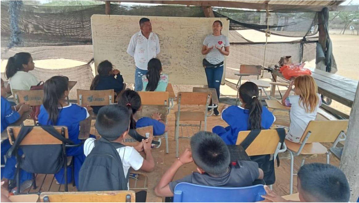
Figura 10. Evidencias de implementación de la estrategia # 2