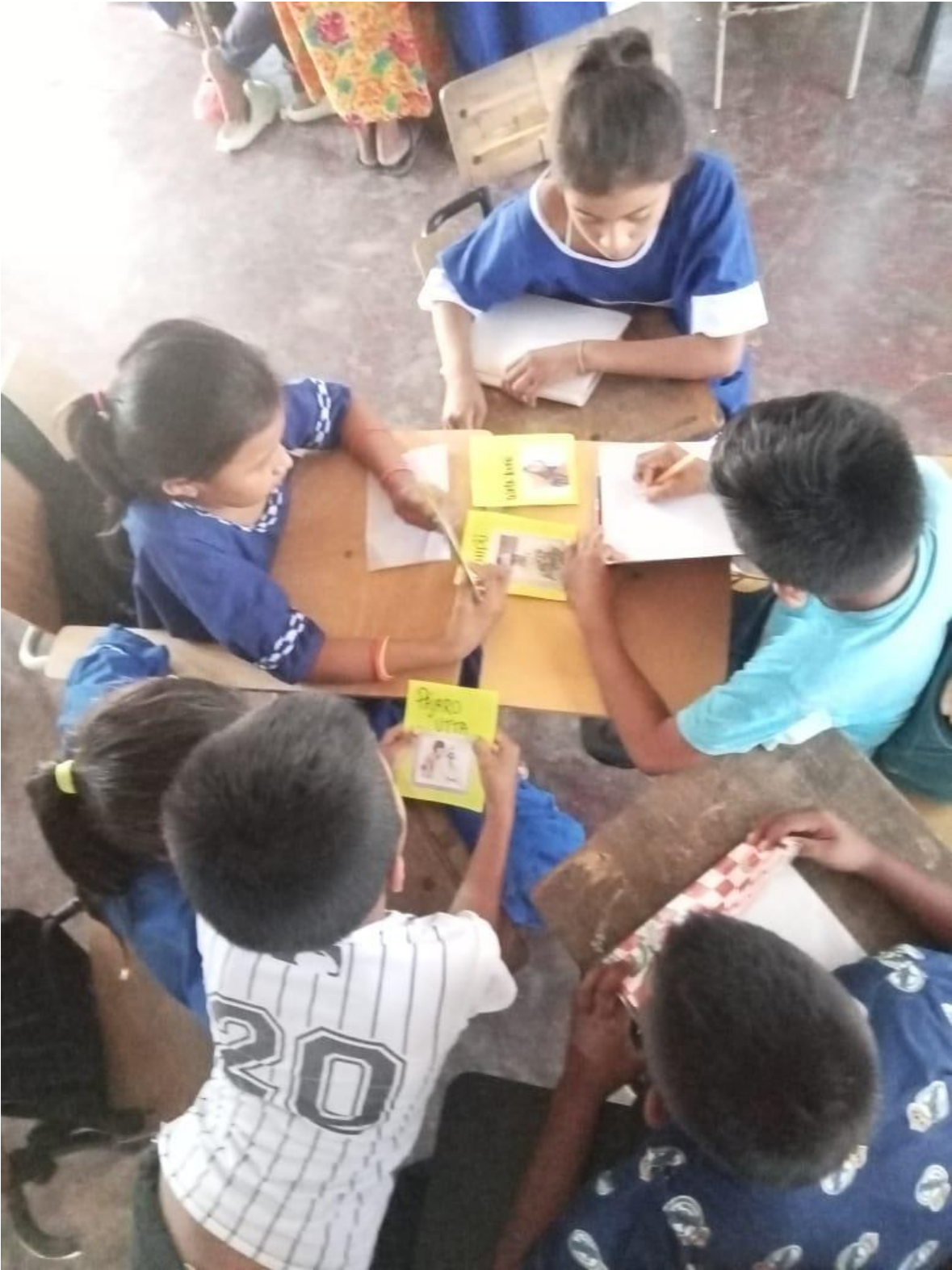
Figura 12. Relato personajes místicos