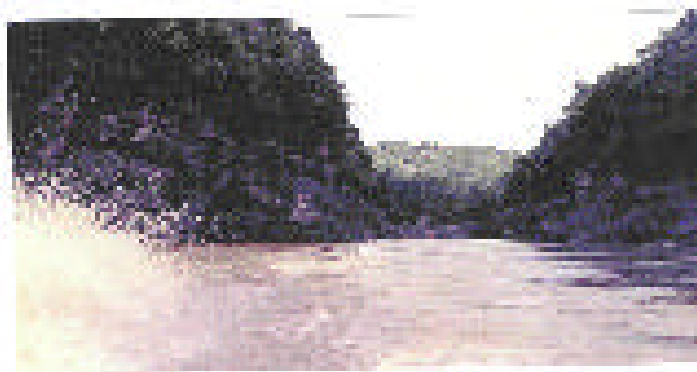
Figura N° 9 MUESTRA DE UNA “PINTURA RUPESTRE NATURAL”