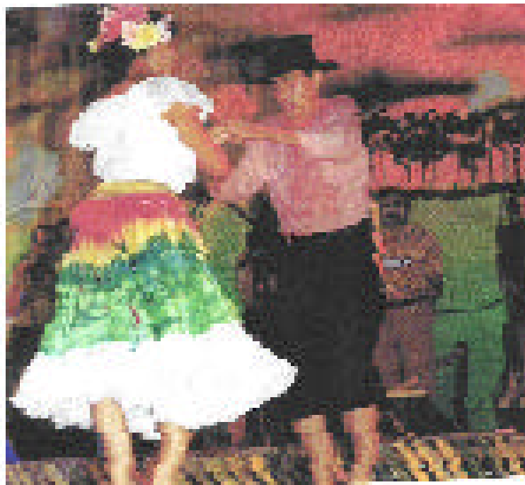
Figura N° 7 FOTOGRAFIA DEL BAILE “EL JOROPO”

Otro elemento folclórico que identifica la región es el joropo o fiesta de los llaneros.