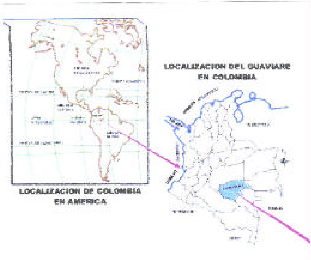
Figura N° 1 LOCALIZACIÓN DE COLOMBIA EN AMERICA Y EL GUAVIARE EN COLOMBIA