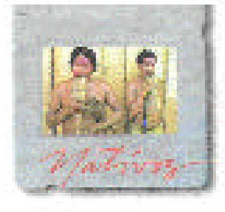
Figura N° 4 FOTOGRAFIA DE DOS INTEGRANTES DEL GRUPO INDÍGENA “LOS

“Una buena cantidad de jóvenes son empleados de comerciantes y del estado, aparentemente es la población indígena más adelantada o desarrollada, sin embargo los Tucanos Orientales han perdido más de 50% de los usos y costumbres autóctonos.