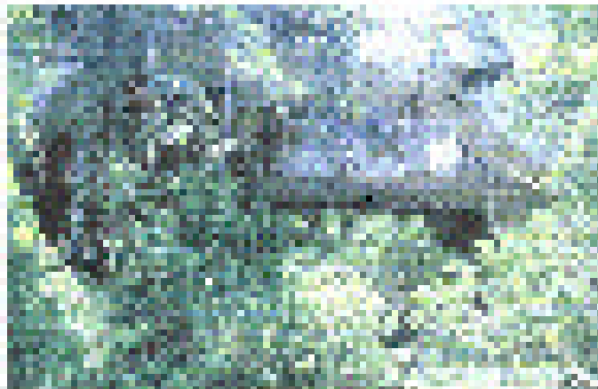
Figura N° 10 MUESTRA DE UN PUENTE NATURAL

Junto a estos puentes encontramos un conjunto de rocas dispersas en un bosque a las cuales el periodista Andrés Hurtado denomina Las Murallas, porque parecen las ciclópeas paredes de una fortaleza.