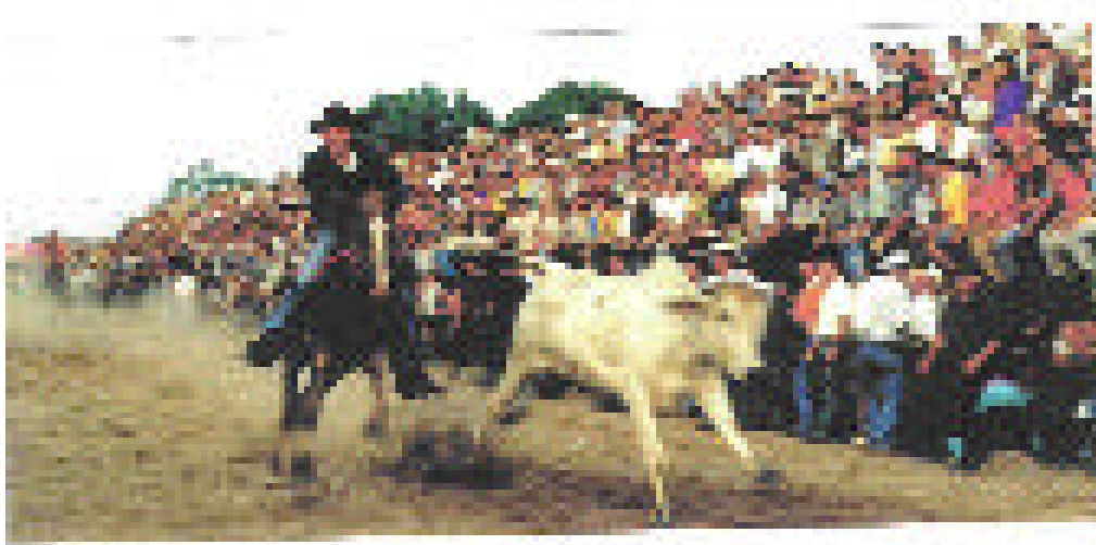
Figura N° 5 MUESTRA DE UNA FAENA TÍPICA “DEL COLEO”

Es difícil, sino imposible no encontrar en cualquier vereda o pueblo un sitio donde colear ganado, para que sirva como espectáculo de recreación en las ferias ganaderas o en las festividades. Esta faena nació del duro trajín impuesto en las faenas de trabajo del arreador, hace muchos años, antes de ser adoptado como deporte “se practicaba para demostrar sus habilidades entre ellos mismos, que como arreadores cada uno tenía”.