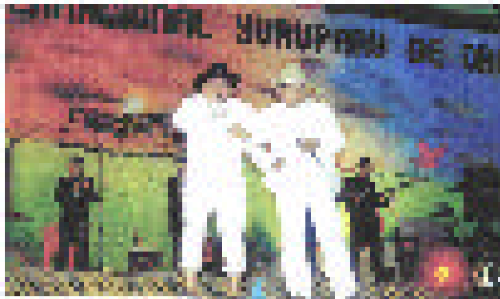
Figura N° 6 MUESTRA DE UN “CONTRAPUNTEO” CELEBRADO EN LA FIESTA DEL YURUPARI DE ORO

El contrapunteo debe ser entre dos copleros, pero suele ocurrir que se inicia con más. Al iniciar, el cantador hace preguntas las cuales debe responder su oponente, de lo contrario, al no responder adecuadamente tiene que darse por vencido, el contrapunteo es enervante, se siente la emoción parecida al correr en competencia a caballo o en autos. Se manifiesta como un desafío.