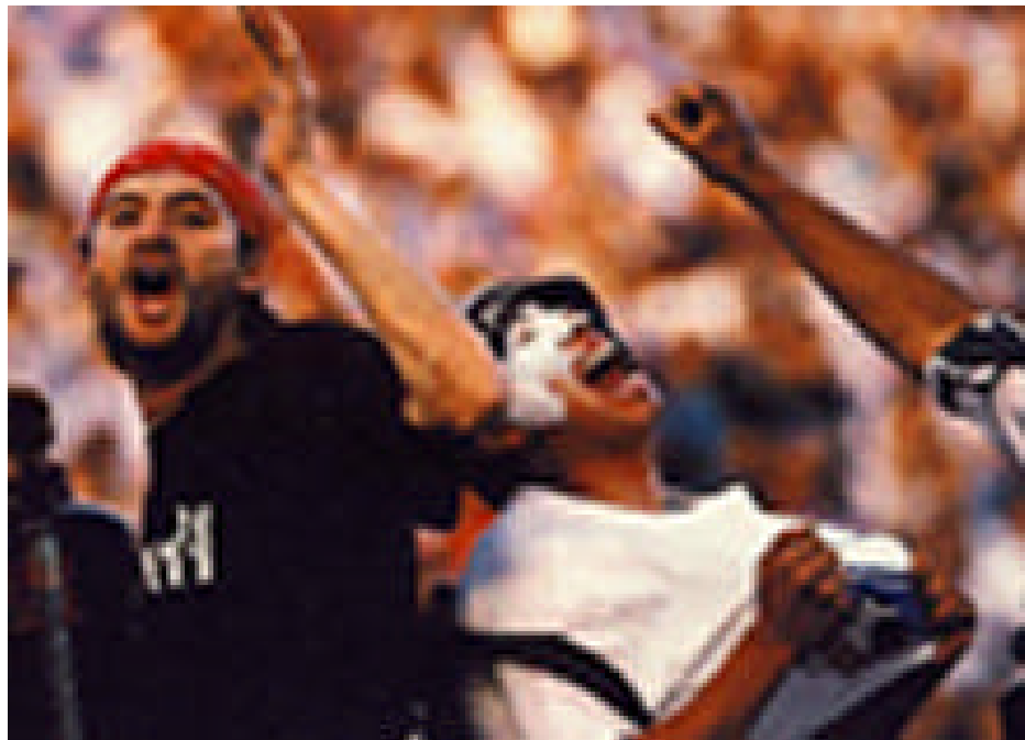
‘La Doce’. Barra Brava de Boca Juniors de Argentina

Debemos tener en cuenta que la violencia europea en el fútbol y en el mundo 5 , ha sido en muchos casos enfrentamientos entre las barras de cada país. En el continente americano, no se han presentado casos de este tipo, los problemas han sido internos, entre barras de clubes nacionales.