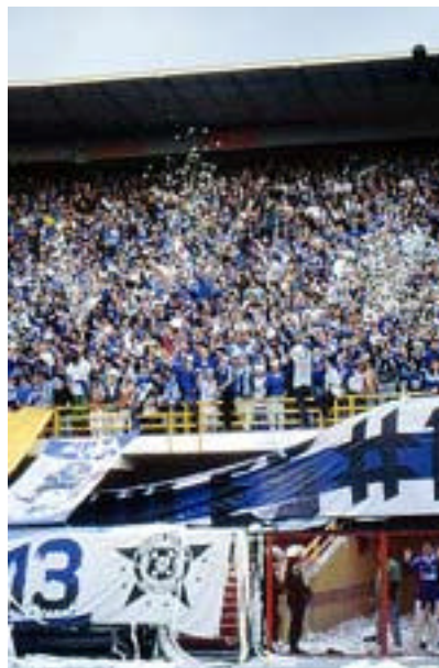
Comandos Azules # 13. Tribuna Norte Estadio Nemesio Camacho “El Campin”

La actitud de un hincha, desde luego, resulta muy diferente de la del mero espectador que simplemente acude al estadio a pasar un buen rato. Para Vicente Verdú, autor de un agudo ensayo sobre los mitos, ritos y símbolos del fútbol, “El espectador termina cuando termina el partido. El hincha en cambio no pasa la tarde, sino que la precede y la sucede, la absorbe y la soporta”. 6