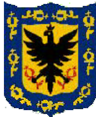
Escudo de Bogotá D.C.