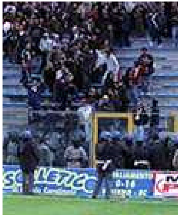
Enfrentamientos en la Tribuna Norte de los Comandos Azules.

naturaleza si existen determinados factores que pueden hacer que se torne violento como su estado natural, situación o modo.