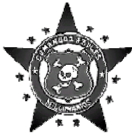
Escudo representativo Comandos Azules