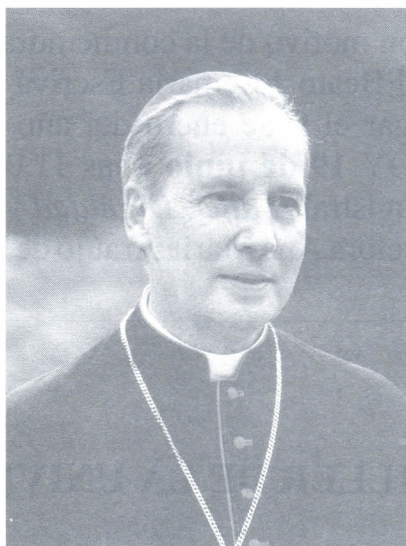
Monseñor Javier Echevarría

En particular, ha conocido de cerca la realidad de los países del Centro y Este de Europa, con ocasión del comienzo de la labor del Opus Dei en algunos de esos lugares. Los viajes pastorales que realizó con el Fundador -a Europa y América- y con