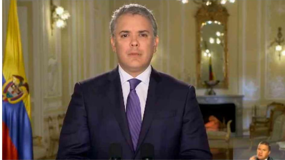
Imagen 2. Publicación de la Revista Semana en la que se priorizan los frames de Consecuencias y Problemas.

Estos hallazgos nos permiten demostrar que la hipótesis 1 es parcialmente verdadera. Puesto que la Revista Semana si se enfoca en frames relacionados a los problemas, pero El Espectador no prioriza las soluciones, para este medio, es más relevante comunicar las consecuencias que se derivan de la Jurisdicción Especial para la Paz.