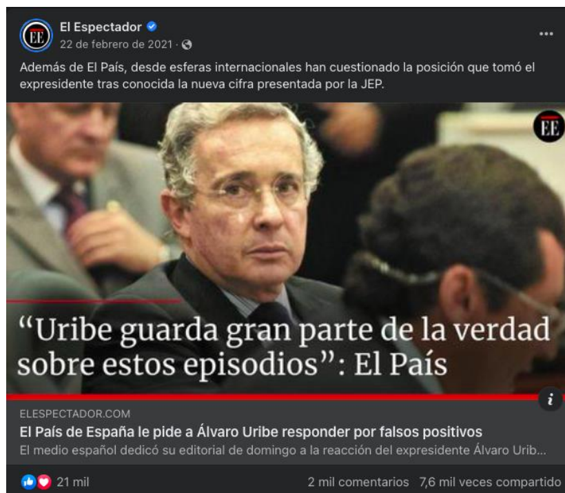
Imagen 3. Noticia sobre el Caso 03 que más reacciones alcanzó.

Con base en estos resultados, podemos evidenciar que la hipótesis 3 es parcialmente correcta, pues las retenciones ilegales de personas por parte de las Farc-EP no hacen parte de los tres temas principales. Si bien no es el más importante, sigue liderando los temas de la agenda con mayor interacción, en la posición 5.