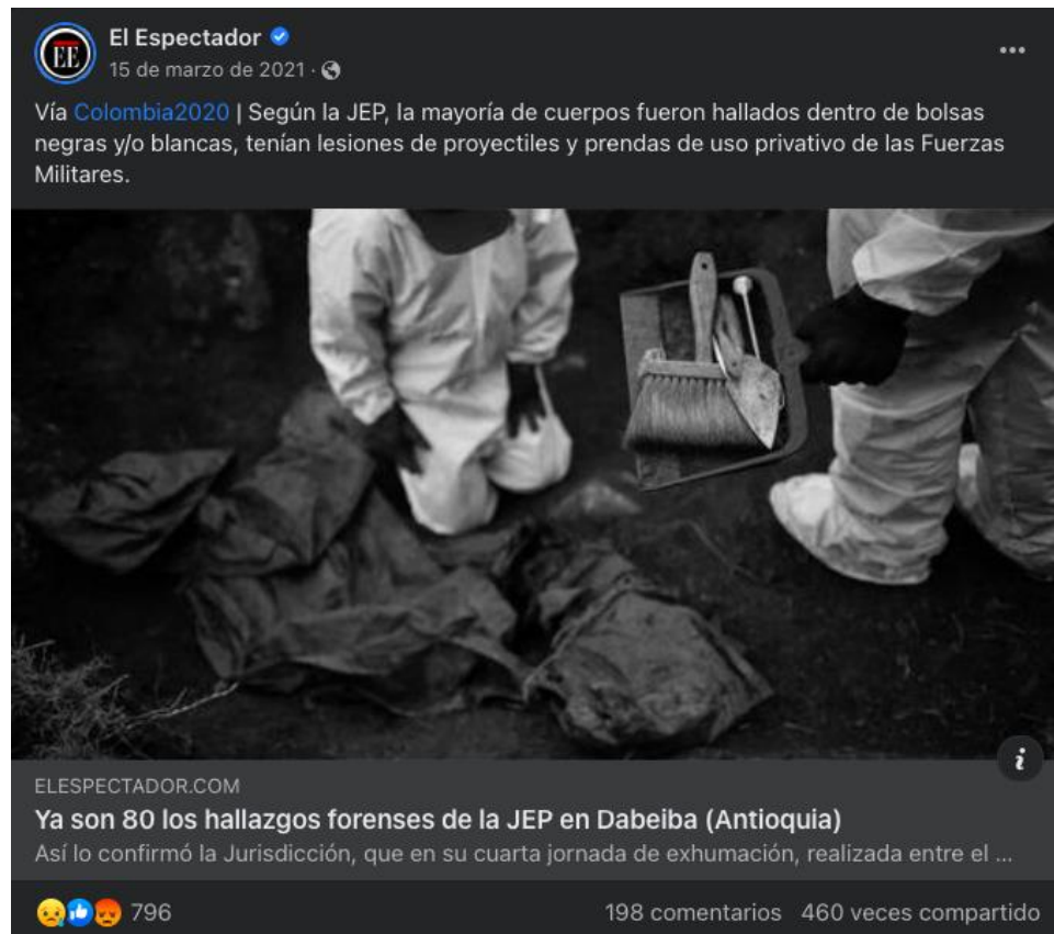
Imagen 1. Publicación de El Espectador que contiene los frames de Consecuencias, Problemas y Soluciones.

las Soluciones no son un tema a priorizar, dado que ocupa el porcentaje más bajo de la muestra estudiada. No obstante, en comparación con la Revista Semana, El Espectador logra un cubrimiento más equilibrado, ya que este diario tiene una variación menor en tres de los frames analizados (Causas, Problemas y Soluciones).