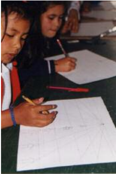
No. 5. Afirmando los conocimientos de perspectiva.