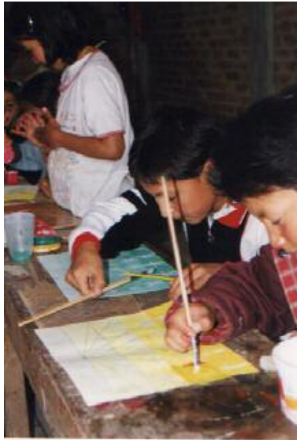
No. 7. Aplicando la técnica de acuarela.