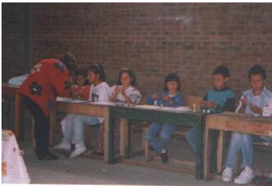
No. 2. Elaboración de trabajos con hojas de papel de revista.