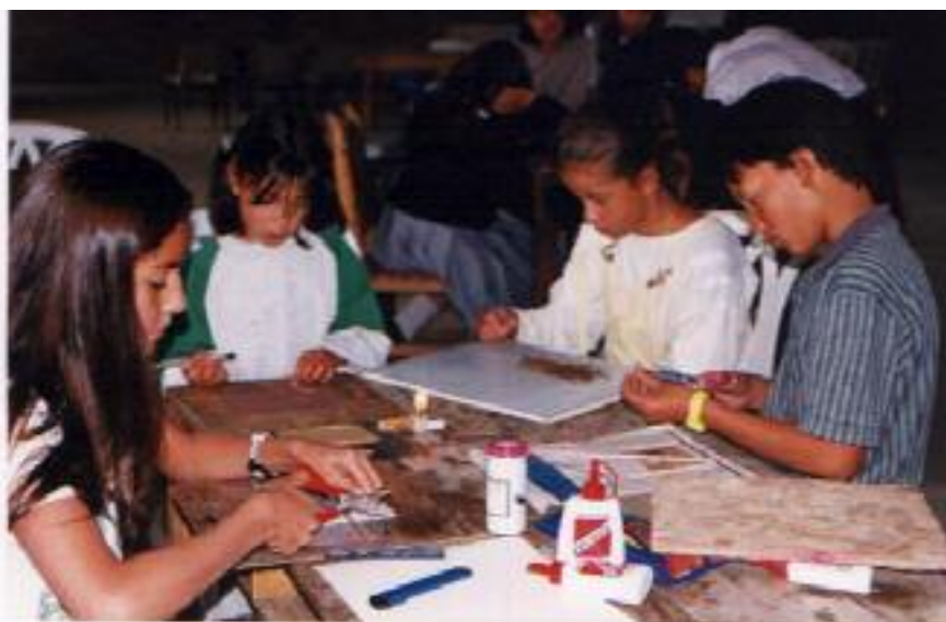
No. 1. Etapa inicial del taller. Los niños dibujan su propio diseño.