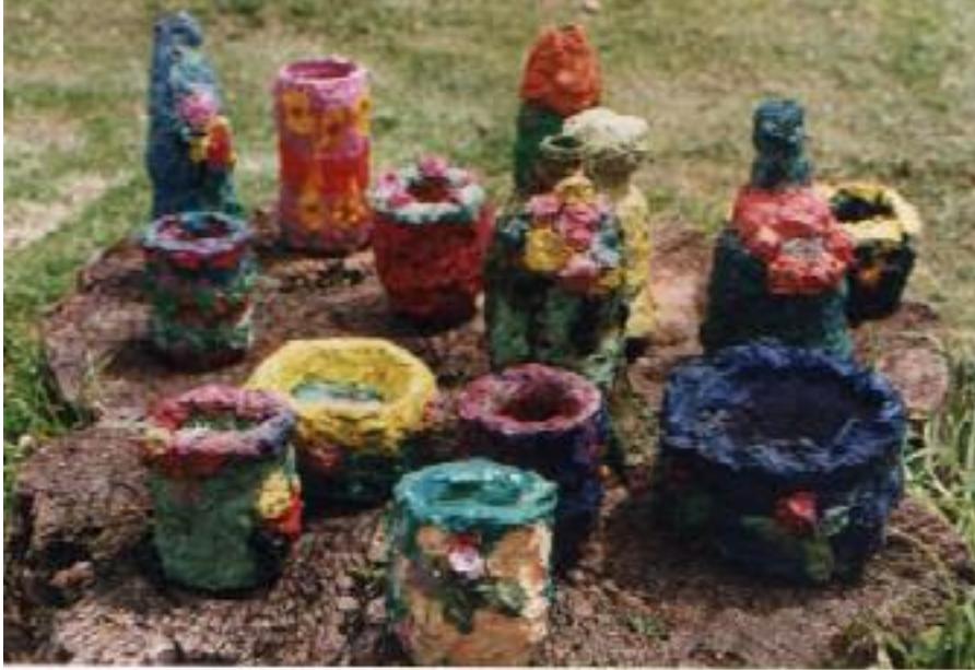
No. 5. Exposición final de los trabajos.