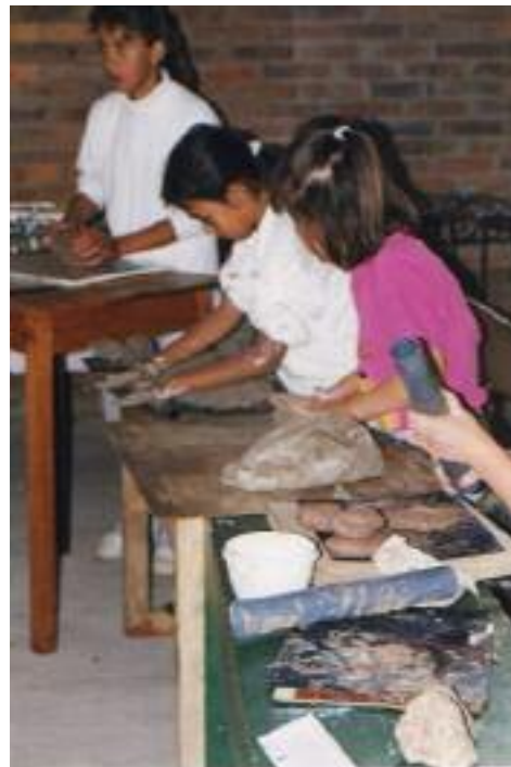
No. 1. Etapa inicial del taller de Modelado.