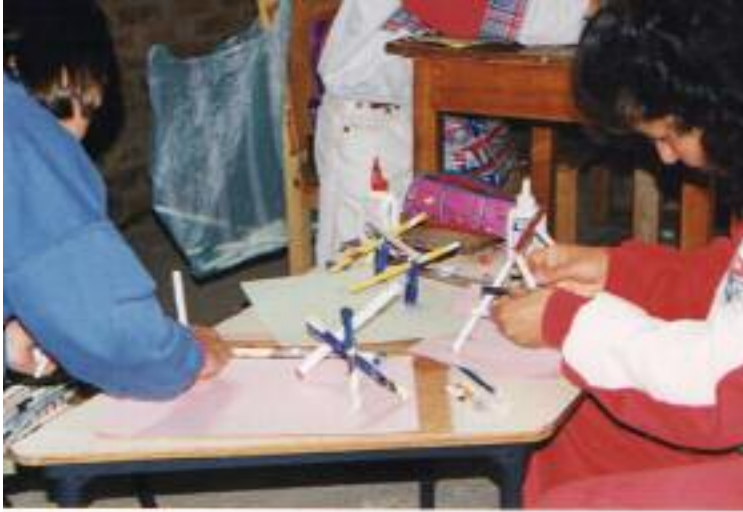
No. 4 Unión y ensamblaje para iniciar la construcción.