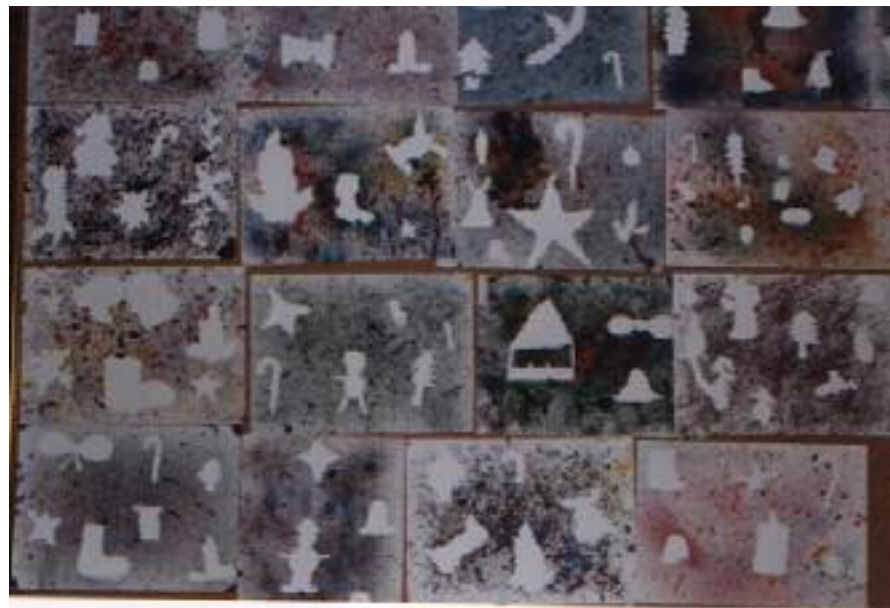
No. 4. Exposición final de los trabajos.