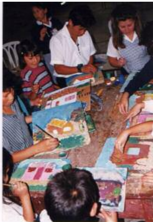
No. 4. Creativamente van pegando material de la naturaleza a su propia obra.