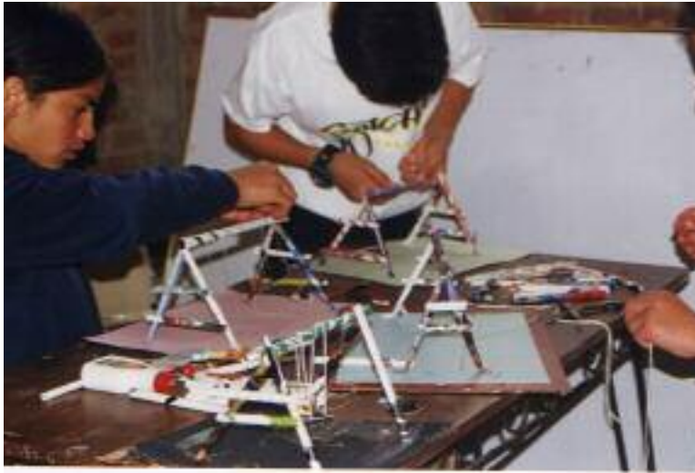
No. 6 Etapa final de la construcción de un parque de diversiones.