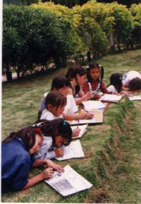
No. 2. Observa cada detalle, lo plasma mediante la técnica del carboncillo.