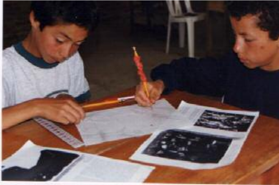
No. 1. Etapa inicial del taller a partir de la obra de Picasso.