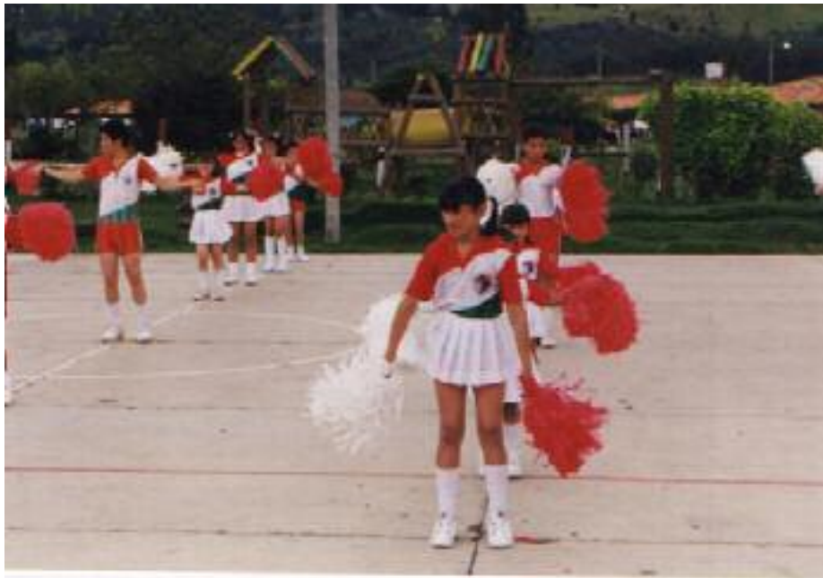
No. 3. Visualización y ubicación de la perspectiva en el grupo.