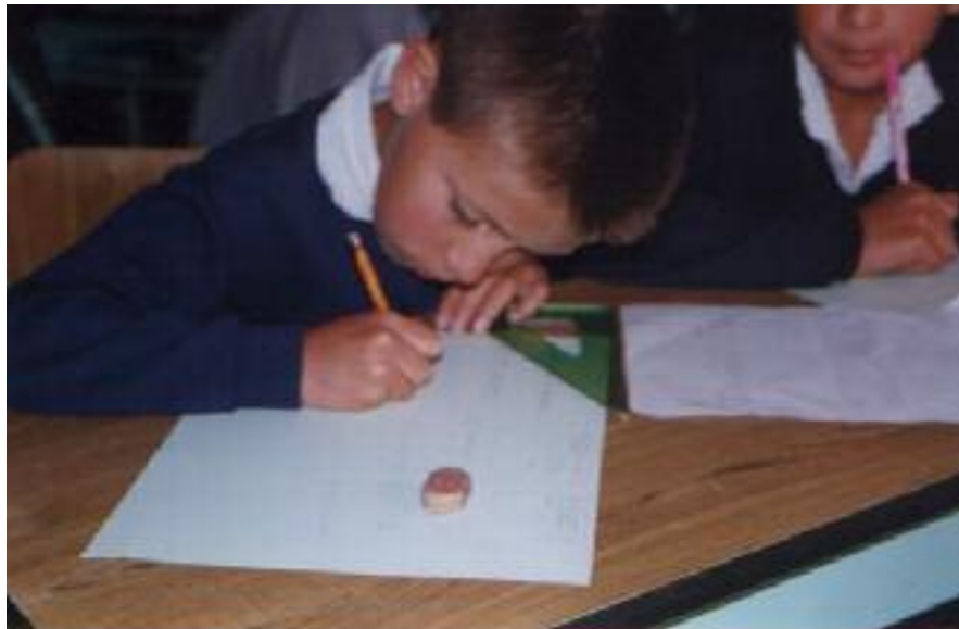
No. 3. Elaboración de viñetas que conformaran la historieta.