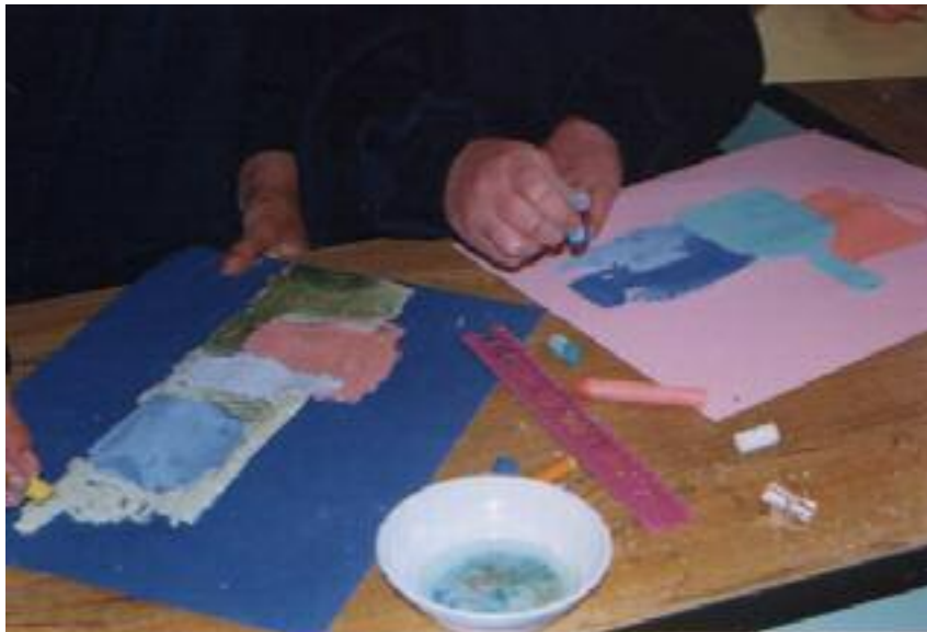
No. 3. Aplicando tizas de colores con agua.