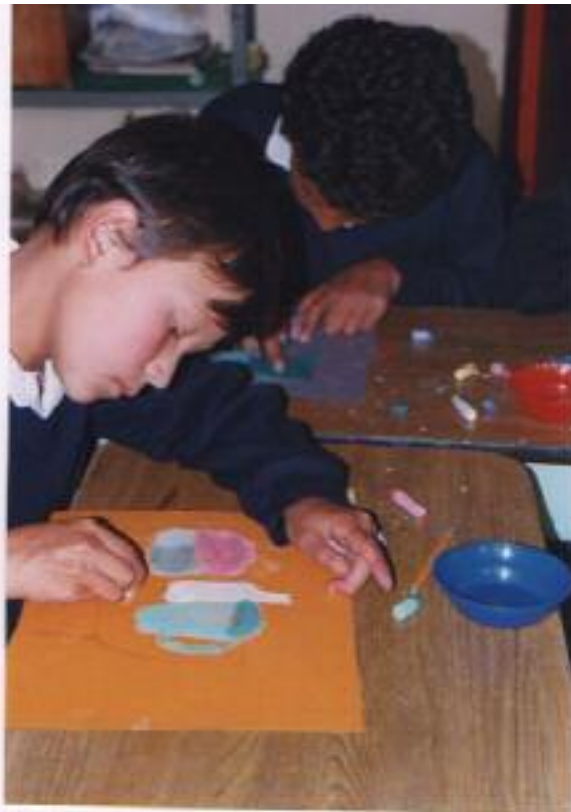
No. 2. Aplicación y experimentación de la técnica, tizas de colores.