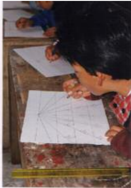
No. 6. Ubicando en el plano bidimensional a cada uno de sus computadores de la revista