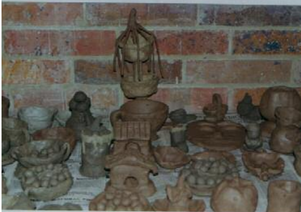
No. 6. Exposición final de los trabajos.