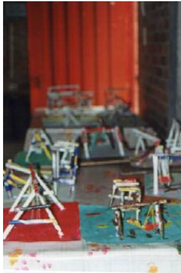
No. 7. Exposición de trabajos terminados.