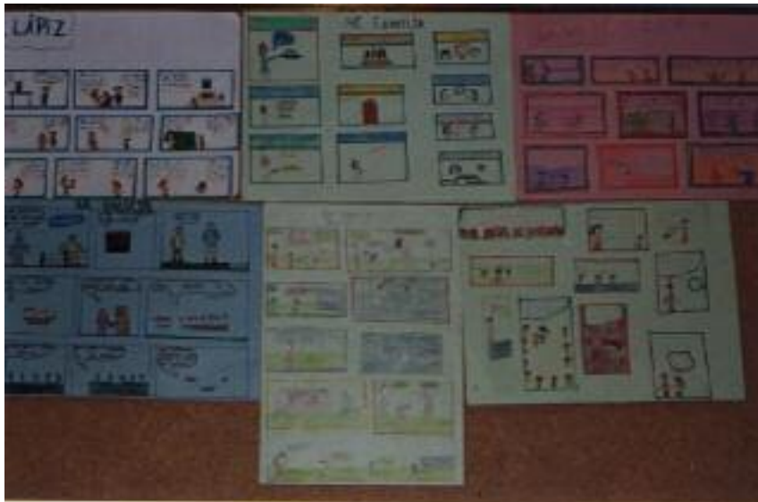
No. 5. Exposición final de las historietas terminadas.