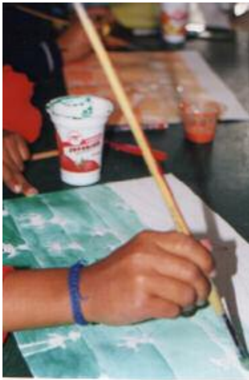
No. 8. Degradando el color.