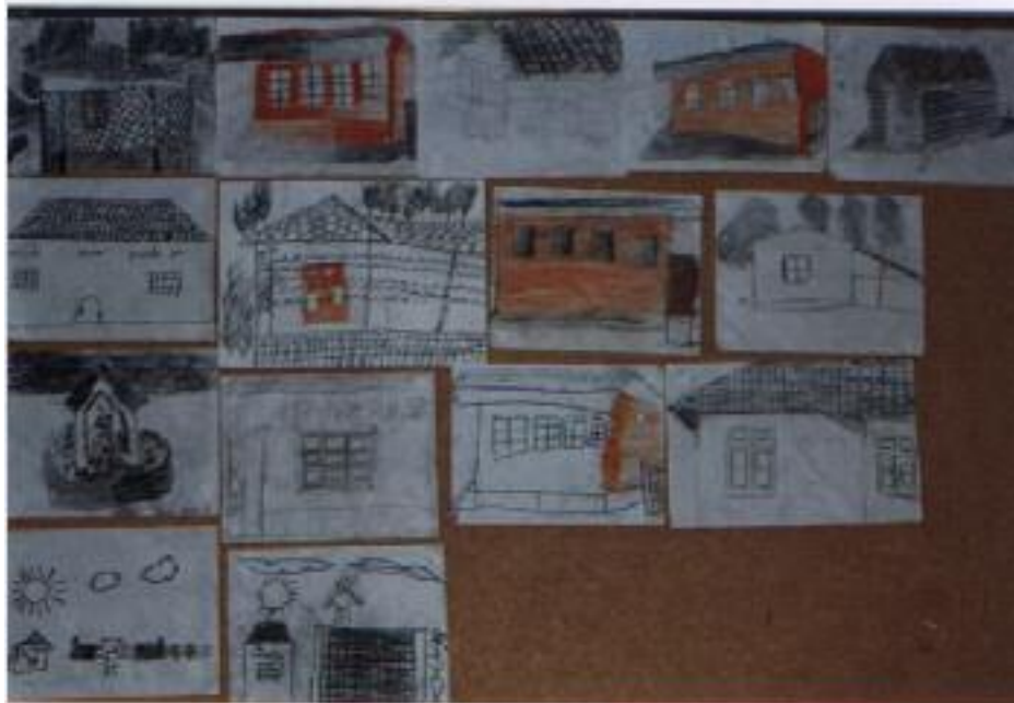
No. 4. Exposición del trabajo final.