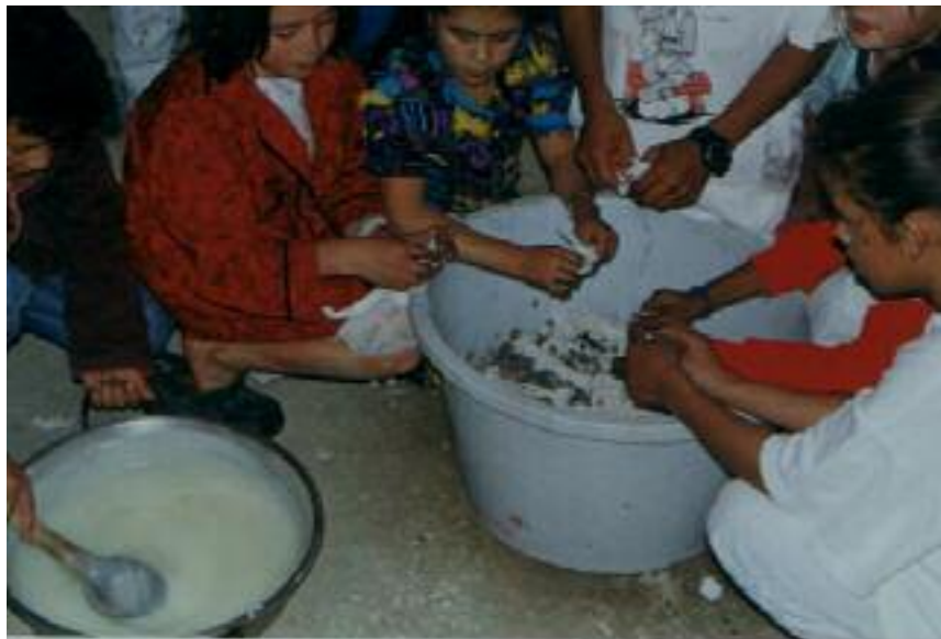
No. 1. Fase inicial del taller en papel Maché.