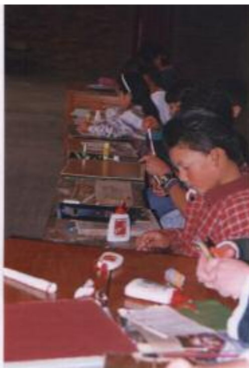
No. 3. Organización del soporte donde se colocará la construcción.