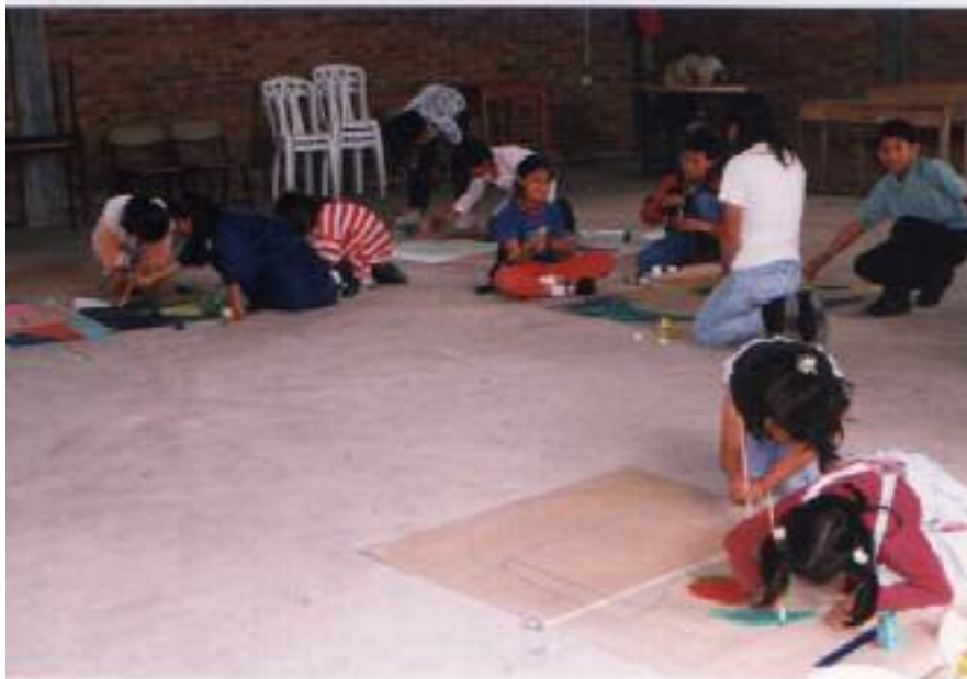
No. 4. Siguen aplicando el color libremente.