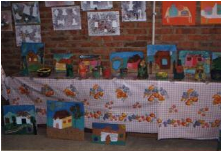
No. 5. Exposición final del taller de collage terminada.