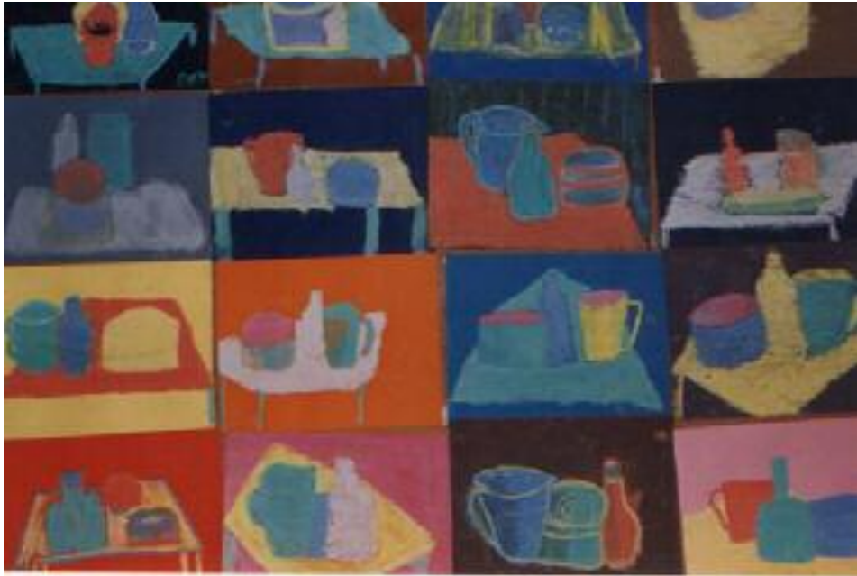
No. 4. Exposición de los trabajos terminados.