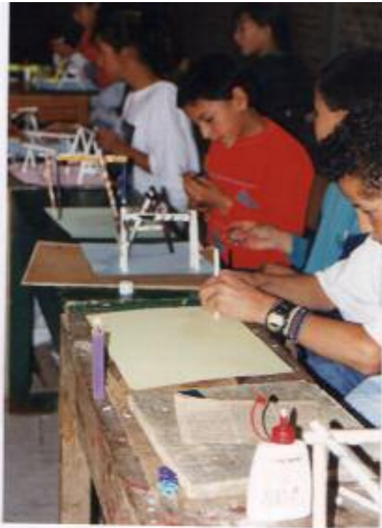
No. 5 Montaje y organización sobre el plano bidimensional.