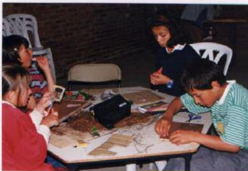
No. 2. Organizan y seleccionan el material que emplearán para realizar el collage.