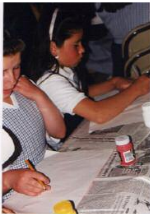
No. 1. El niño desarrolla la creatividad e imaginación a partir del dibujo.