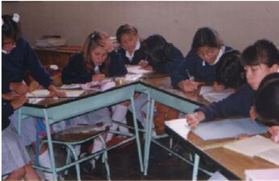
No. 2. Redacción de un breve guión para una historieta.