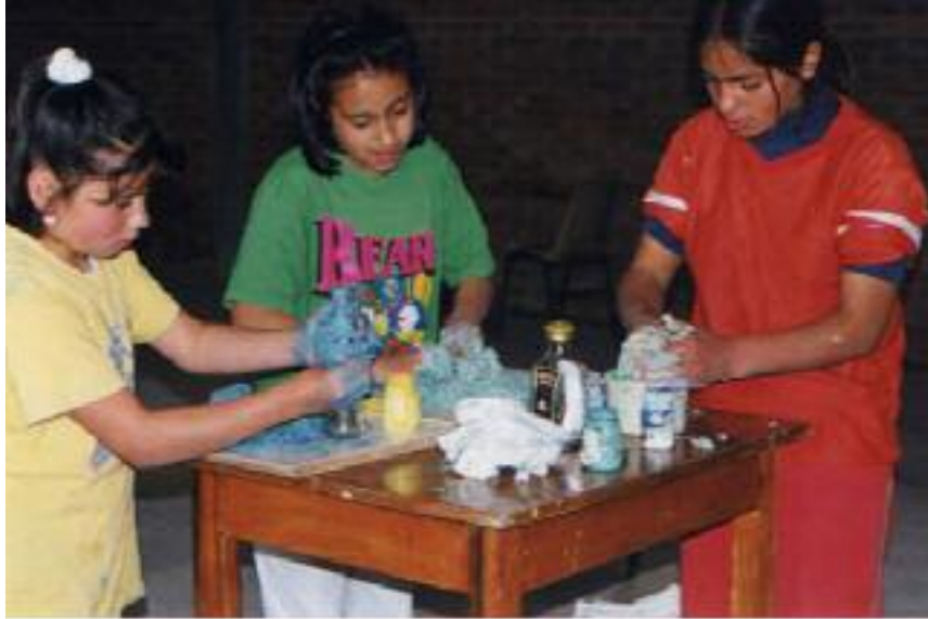
No. 3. Mezclan la masa de papel con el color.