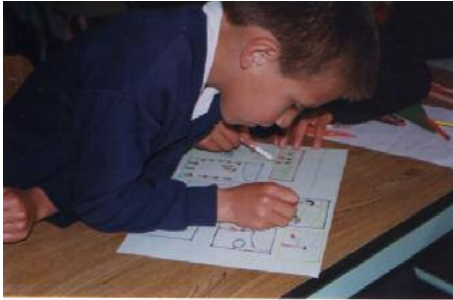
No. 4. Elaboración de los dibujos con lápices de color de la historieta.