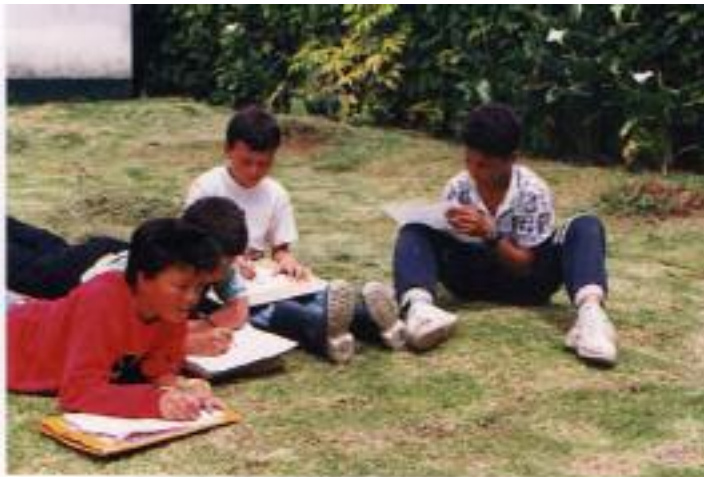
No. 1. Se ubica en un rincón de la escuela y hace el boceto de lo que lo llama la atención.