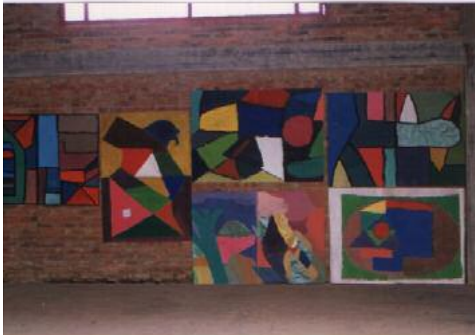
No. 7. Exposición final de los trabajos terminados.