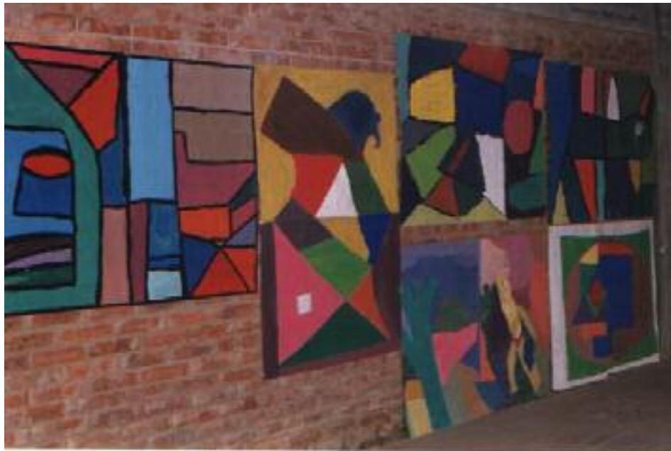
No. 6. Se refleja la armonía y ritmo en la composición de la obra.