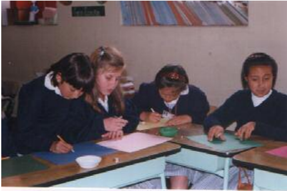
No. 1 Boceto previo del Bodegón.