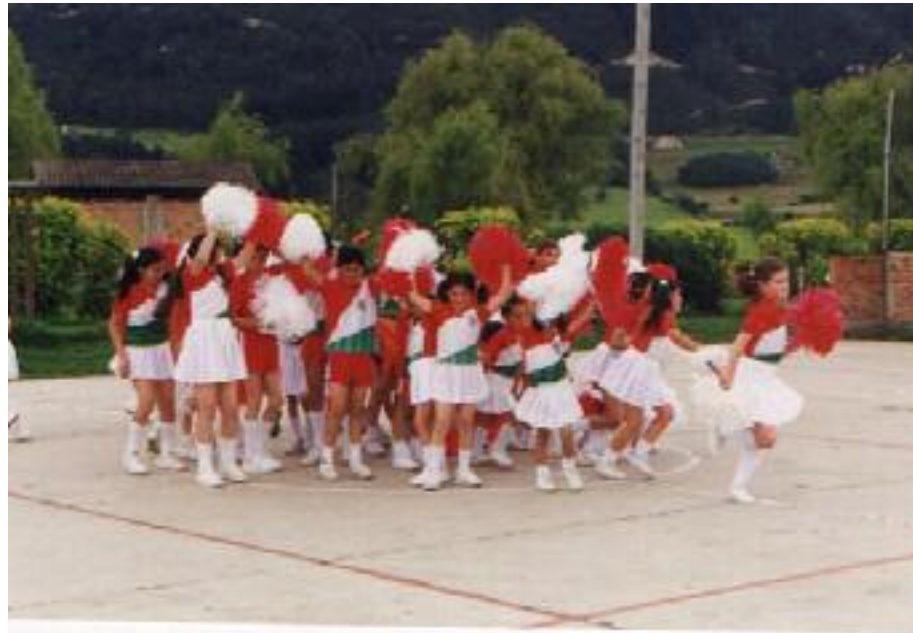
No. 1. Etapa inicial del taller.