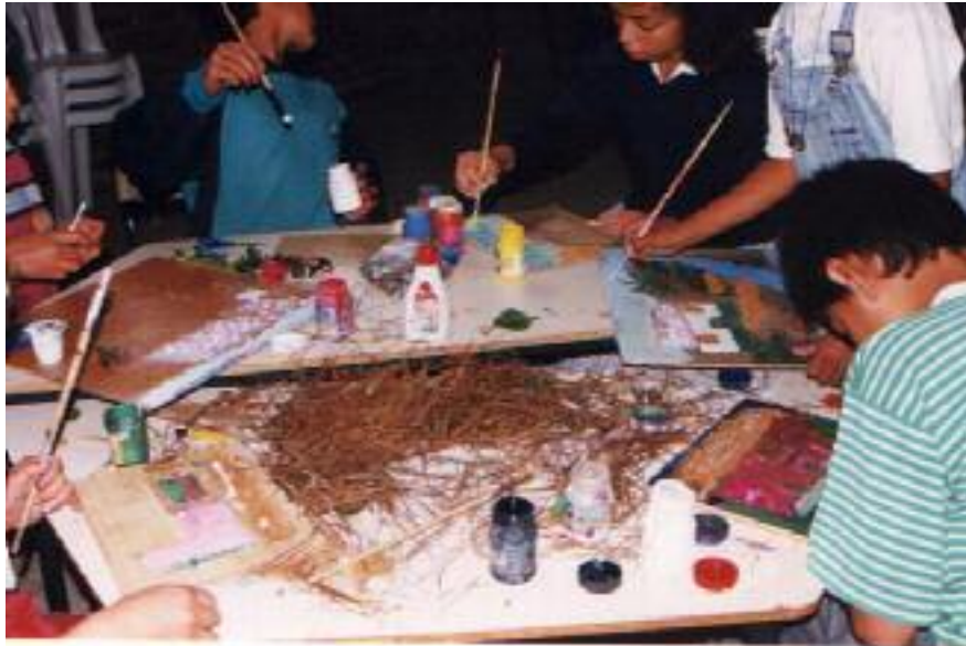
No. 3. Pintando con tempera los fondos del paisaje.