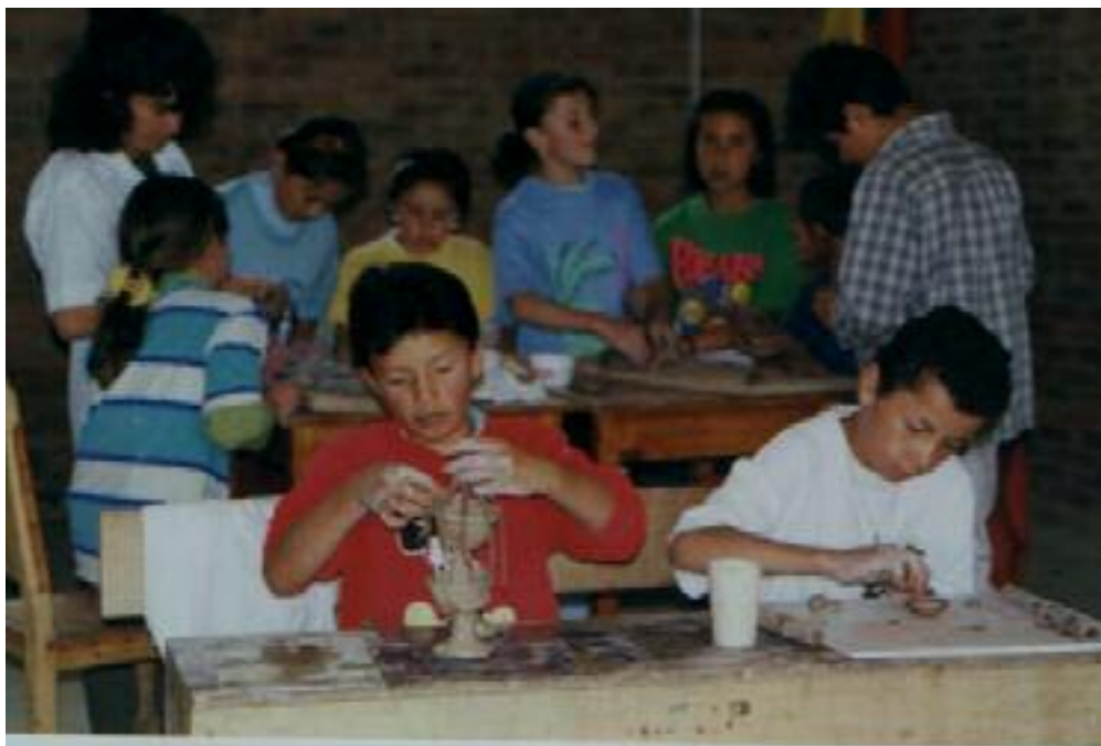
No. 5. Cada niño es dueño de su propia imaginación.