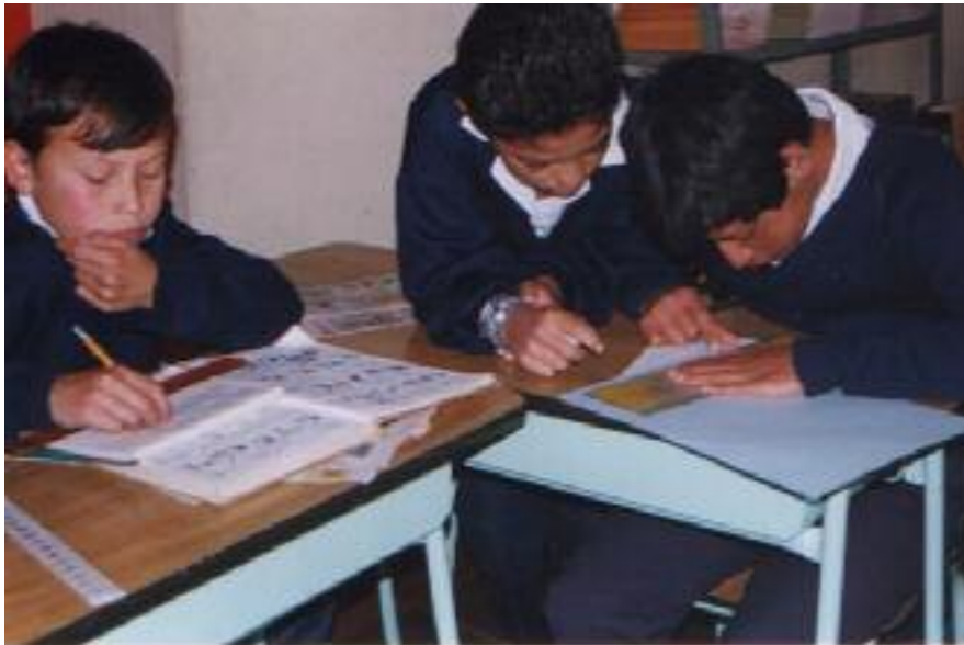
No 1 Etapa inicial. Visualización historietas de revistas y periódicos.