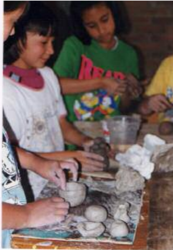
No. 4 El niño comunica lo que siente a través de su expresión creadora.