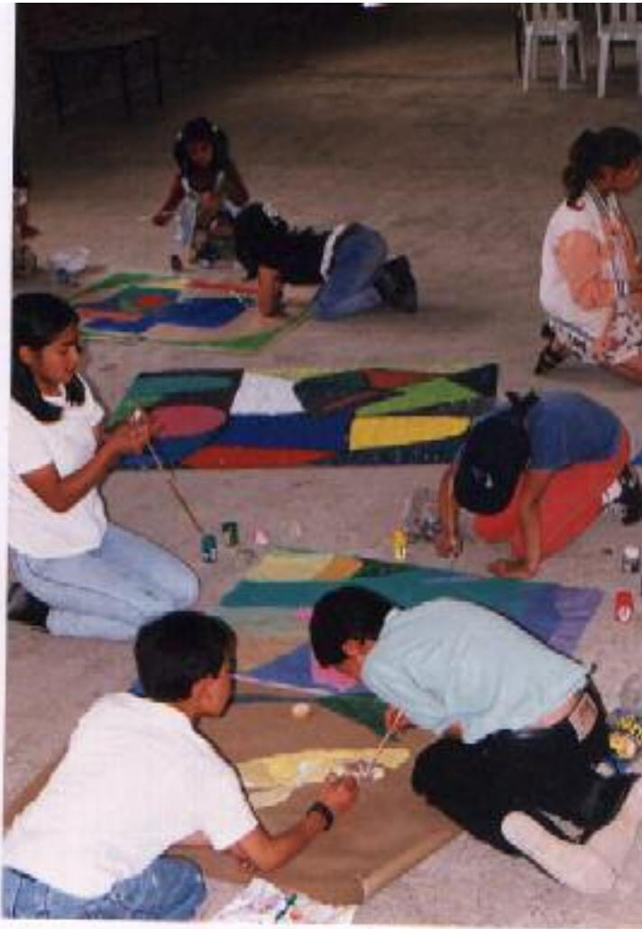
No. 5. Comparten y socializan el trabajo con sus compañeros.