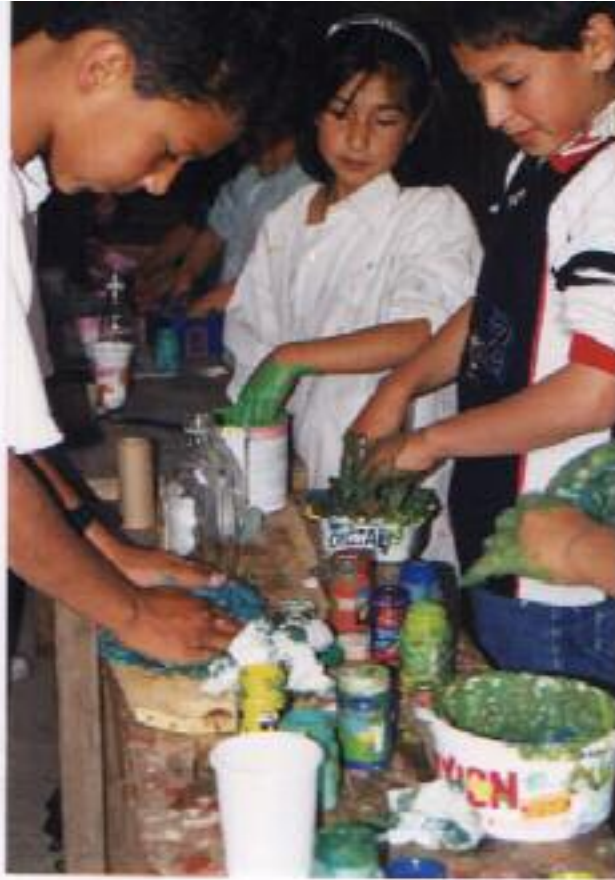
No. 2. Cada niño aplica creativamente tempera a su porción de papel maché.