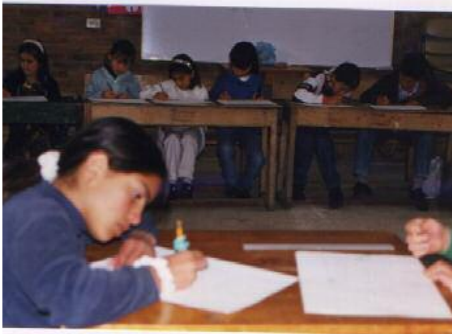
No. 4. Etapa inicial del trabajo artístico.