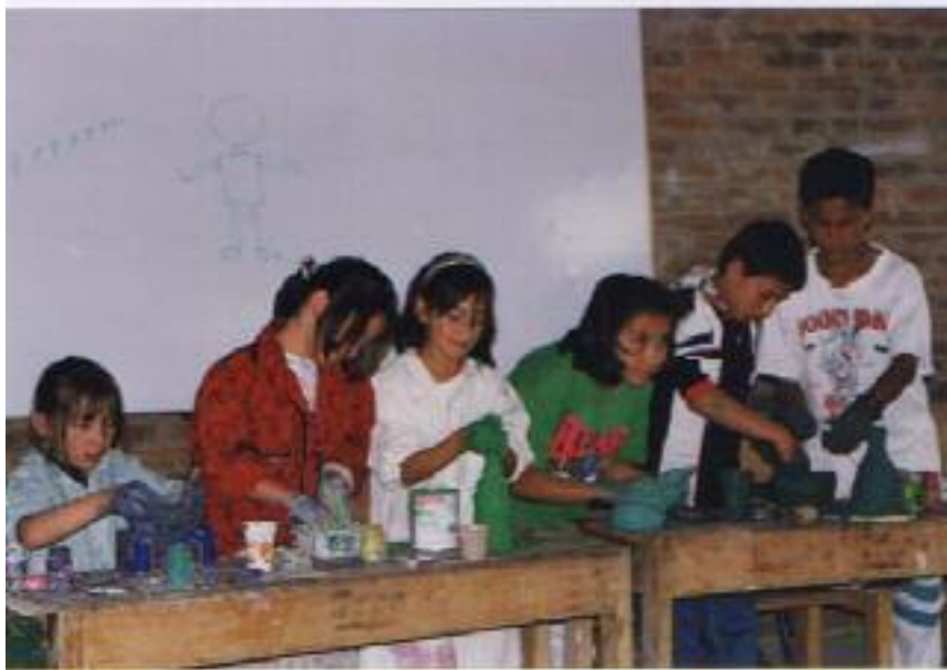
No. 4. Creativamente cada niño, va cubriendo un objeto, resaltando su forma.