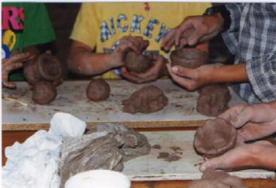
No. 3. Elaboración de figuras a partir de la propia imaginación y creatividad del niño.