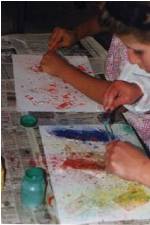
No. 3. El niño realiza la técnica del estarcido.