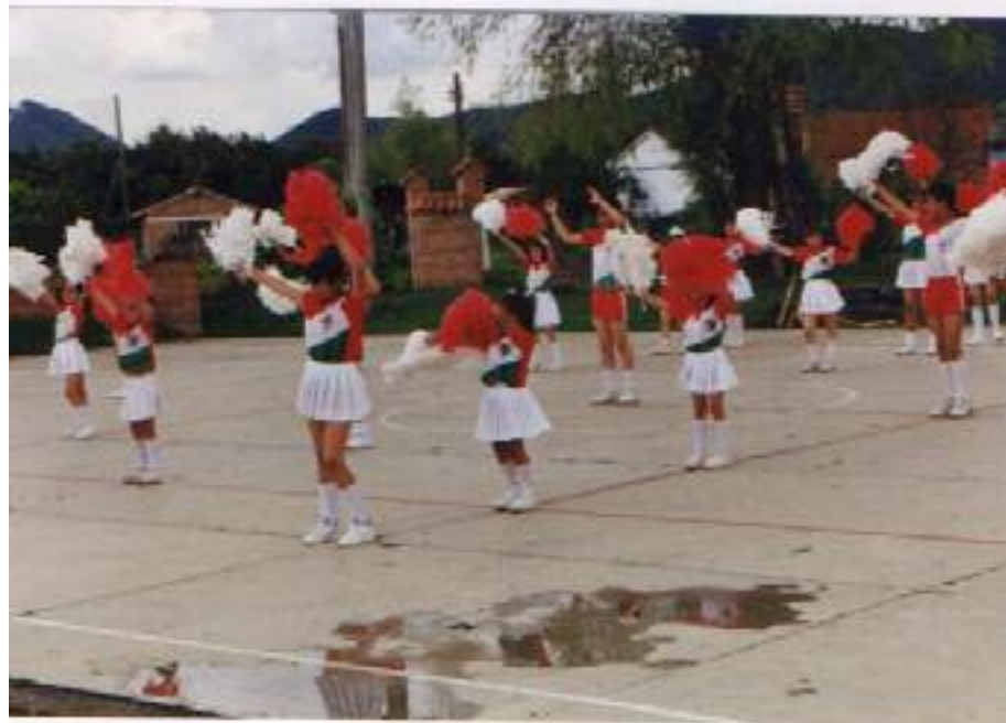
No. 2. Organización y ubicación de cada alumno dentro del grupo.