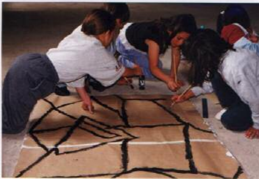
No. 2. Por grupos los niños dividen el papel, destacando creativamente diferentes formas geométricas.