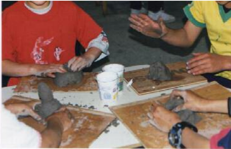
No. 2 Manipulación y familiarización con el material.