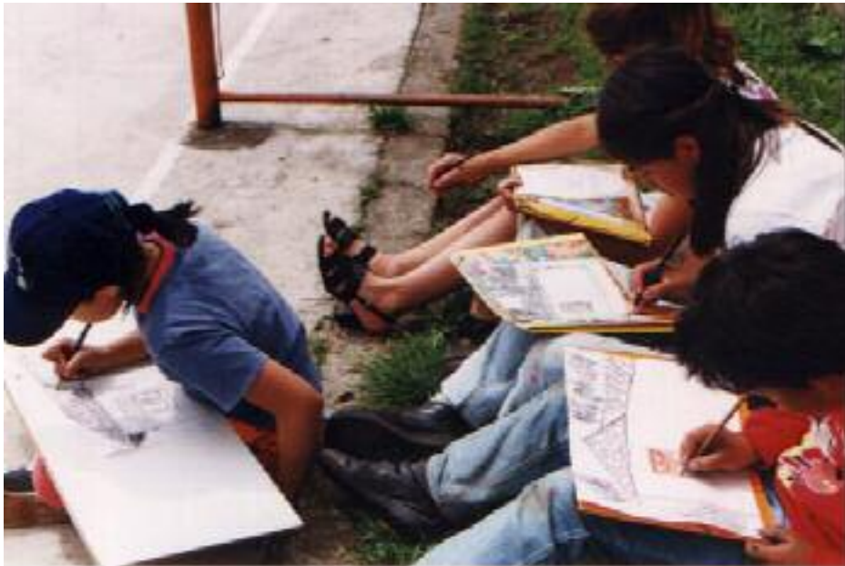
No. 3. Combina la técnica del carboncillo con sanguina.