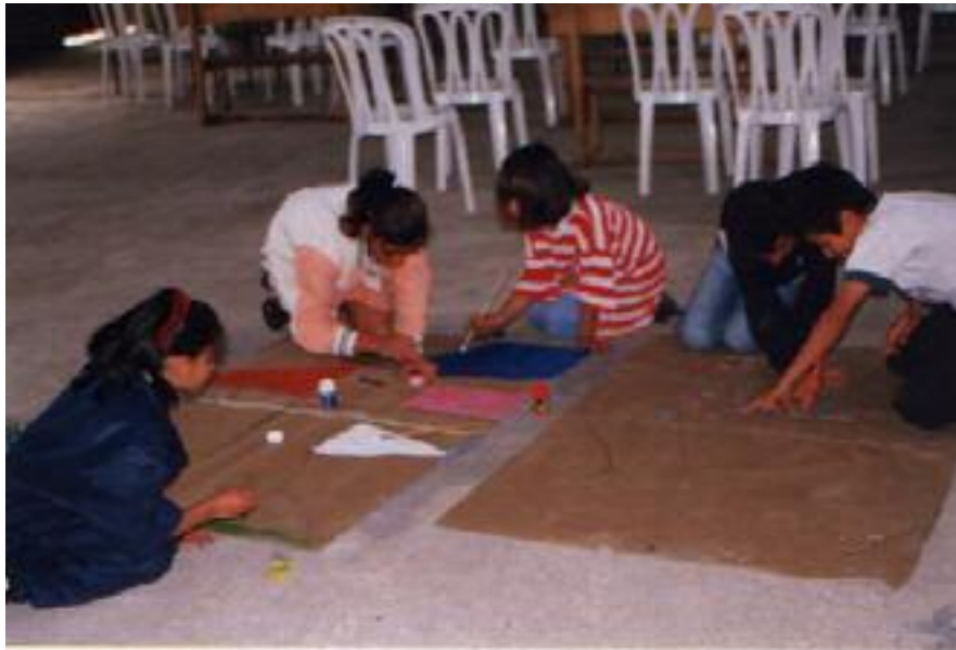
No. 3. Aplican el color libremente.