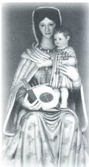
Nueva Virgen de la Ermita.

Como les contamos en la edición pasada de ENLACE, este 21 de Septiembre la Universidad cumplió su vigésimo aniversario. Para celebrarlo, se realizaron a lo largo de todo el mes una serie de actividades dentro de las que se destacan la del 8, día de la Natividad de la Santísima Virgen, fecha escogida para la llegada definitiva a la Universidad de la Virgen Madre del Amor Hermoso, patrona de la Universidad y quien quedó instalada de manera definitiva en la Ermita. Ese día se celebraron las dos misas en honor a la Virgen y se consagró tanto a los alumnos como a todo el personal que labora en la universidad y a sus familias, a la Virgen Madre del Amor Hermoso.