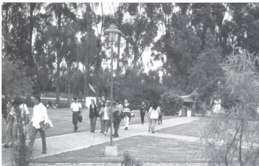
Campus Universitario del Puente del Común

Es muy común escuchar, sobre todo a quienes ya se desempeñan en el ámbito laboral, sus añoranzas por las experiencias vividas en las épocas de estudiantes. Qué afortunados somos quienes podemos combinar el diario vivir y los frutos de ser trabajadores y estudiantes al mismo tiempo, porque supone contar con la oportunidad de experimentar el aprendizaje de un panorama inmenso, de conocimientos e intercambios personales y su transmisión o aplicación en los más diversos campos con personas tan particulares que en sí mismas constituyen un reto para quienes hemos escogido la noble labor educativa.