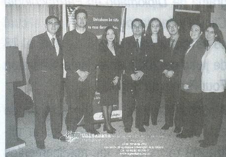
Junta Directiva del Capítulo de Egresados de la Facultad de Medicina de la Universidad.

Dichas juntas directivas, tienen entre sus principales funciones el de elaborar y ejecutar el plan de acción con estrategias para aumentar la participación de los