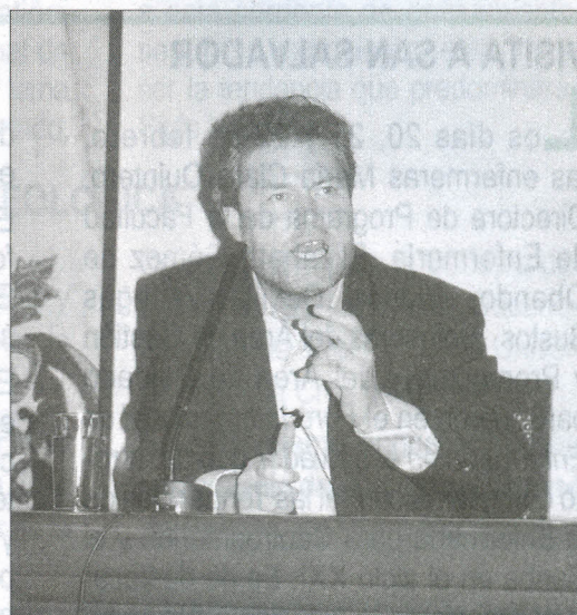
Gunter Pauli propone para el país un manejo apropiado del ecosistema, sin contaminación.

Como parte del tema de su libro explicó, que en la naturaleza los desechos que produce un reino, son aprovechados por otro como nutriente. Sobre esto último citó un ejemplo de la producción de hongos nutritivos como el Chitake, a partir de los desperdicios de la pulpa del café, los cuales servirían de alimento al ganado. Con esta actividad se