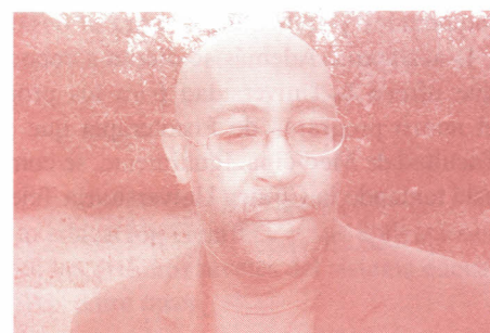
Michell DuCille, Editor de Fotografía del Washington Post, invitado al Panel de Fotoperiodismo.

La esencia del fotoperiodismo la define Michell DuCille, uno de los participantes del panel como: “El fotógrafo debe capturar la imagen utilizando una mano de terciopelo y un ojo de águila”; “El 90% de un trabajo fotográfico está en el anticiparse y tener paciencia. Se debe mirar y observar sin ser partícipe de la historia”.