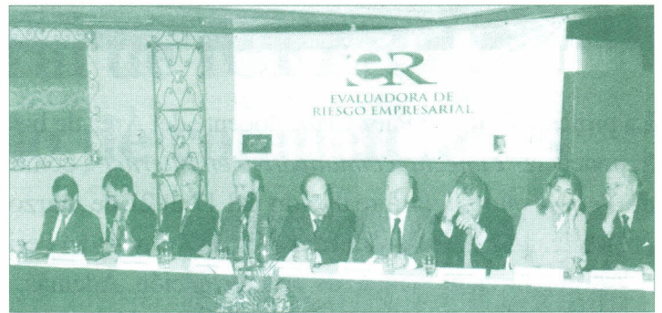
Se destacan en la mesa algunas directivas de la Universidad, el sector empresarial y varias instituciones del gobierno.