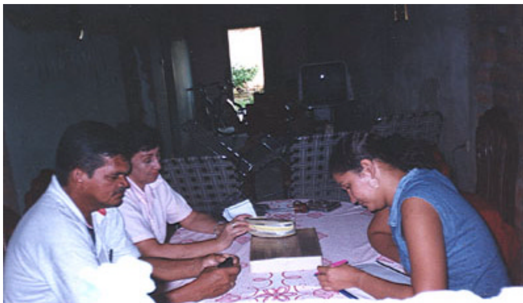
FOTOGRAFÍA No. 1 REUNIÓN PARA CONFORMAR EL COMITE DE RECICLAJE