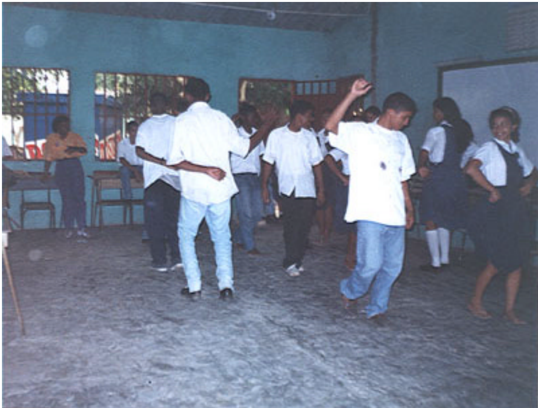
FOTOGRAFIA 10. DANZAS EXISTENTES EN EL CONTEXTO, DIRIGIDA POR UNA MADRE DE FAMILIA