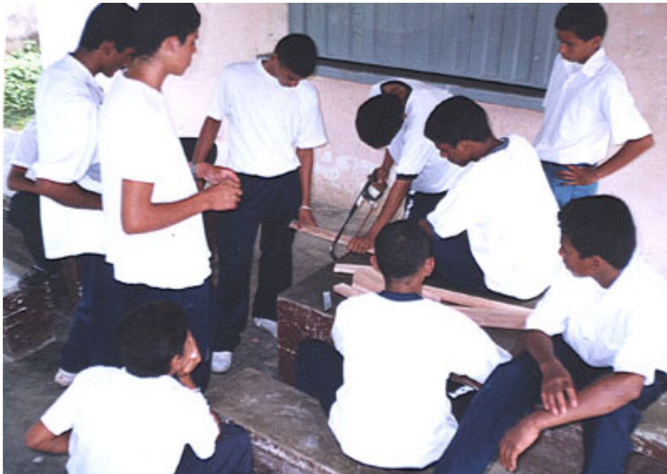
FOTOGRAFIA 9. ELABORACION DE MOLDE PARA RECICLAR EL PAPEL DESECHABLE.