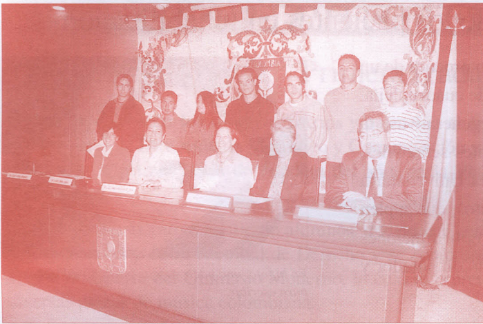
En la foto: Mesa Directiva que premió los mejores proyectos de la pasada Feria Empresarial, luego de la conferencia sobre el éxito estudiantil.