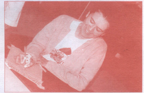
En la foto, una paciente que porta un aditamento para escribir.

Como parte del tratamiento que se realiza en terapia ocupacional en procura de un mejoramiento de la calidad de vida de los pacientes con esquemas de cuadruplejía, hemoplejía, (accidente cardiovascular) y otras enfermedades degenerativas, la Clínica Universitaria Teletón viene atendiendo cerca de 72 pacientes semanales, un 60% de los pacientes de rehabilitación que acuden a la Clínica Universitaria Teletón, para la adaptación de mecanismos denominados aditamentos, que suplen el movimiento de la mano. Los aditamentos son utilizados para cumplir funciones específicas como escribir, abotonar, tomar los alimentos, teclear el computador y otras actividades cotidianas. ■