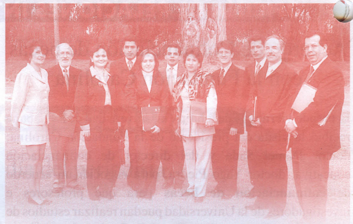
Grupo de directores de Desarrollo Humano que asistieron a la reunión.

Igualmente, en la misma reunión se definió la agenda del año que incluye, entre otros temas: "La contratación de estudiantes en las universidades", "La estructura administrativa de los