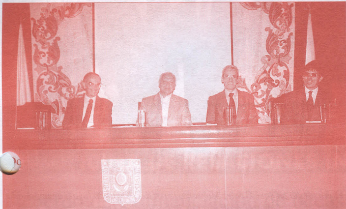
Grupo de geólogos invitados a la conferencia.

La problemática de las aguas subterráneas de la Sabana de Bogotá y la disminución paulatina del líquido de los pozos que surtirán las necesidades de los bogotanos en los próximos cincuenta años y los posibles métodos o estrategias que podrían controlar o solucionar el problema, fue el tema de la conferencia: Geología aplicada a la problemática de las aguas subterráneas , que organizó la Especialización en Ingeniería Ambiental, el pasado 14 de febrero con los estudiantes del programa.