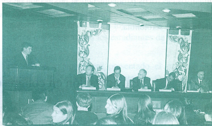
Grupo de conferencistas y académicos que participaron en el evento.

Por su parte, el senador de la República, Rafael Pardo Rueda, desvirtuó las críticas expuestas por Juan Camilo Restrepo, con el argumento de que el Congreso no tiene la capacidad de reformarse a sí mismo y a pesar de que el Referendo no lograría la reforma política ideal, si era al menos un avance en