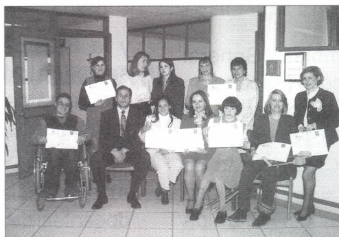
Grupo de personas que recibieron el grado.

Con gran satisfacción, la Corporación para el Desarrollo Social, Codescol, graduó el pasado viernes 6 de junio a 13 estudiantes en el Diplomado de Sistemas Nivel Básico , dirigido a personas con discapacidad y bajos recursos.