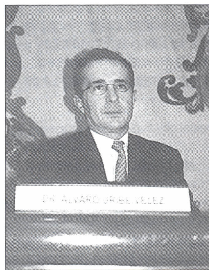
Alvaro Uribe Vélez, inició una serie de visitas de candidatos a la Presidencia para este año, en la Universidad.

En cuanto a su política de seguridad, plantea el incremento de la fuerza pública y la colaboración ciudadana: “es un concepto que he defendido y me ha generado mucha controversia, no lo puedo ocultar, hace falta acompañamiento ciudadano a la fuerza pública. El día que este país tenga un millón de ciudadanos organizados transparentemente, apoyando a la fuerza pública, no necesariamente armados, sino como informantes o colaboradores, ese día empieza el fin de la guerrilla y ese día empieza el marchitamiento del paramilitarismo”.