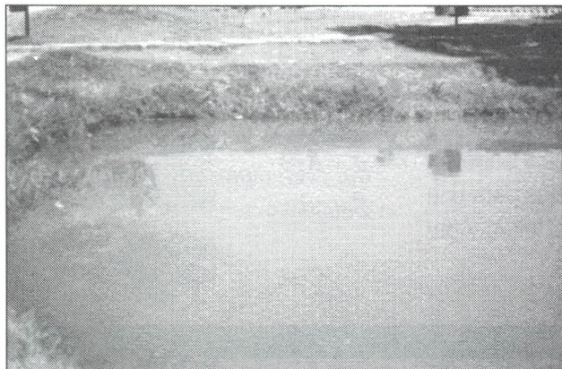
Después de seis meses, el lago recuperó su condiciones ambientales.

La Facultad de Ingeniería, en convenio con la firma Sisvita Technologies E.U., inició el año anterior un estudio académico