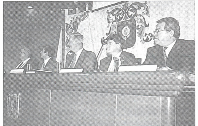
Mesa directiva, en la apertura de actividades del Club de Empresarios.