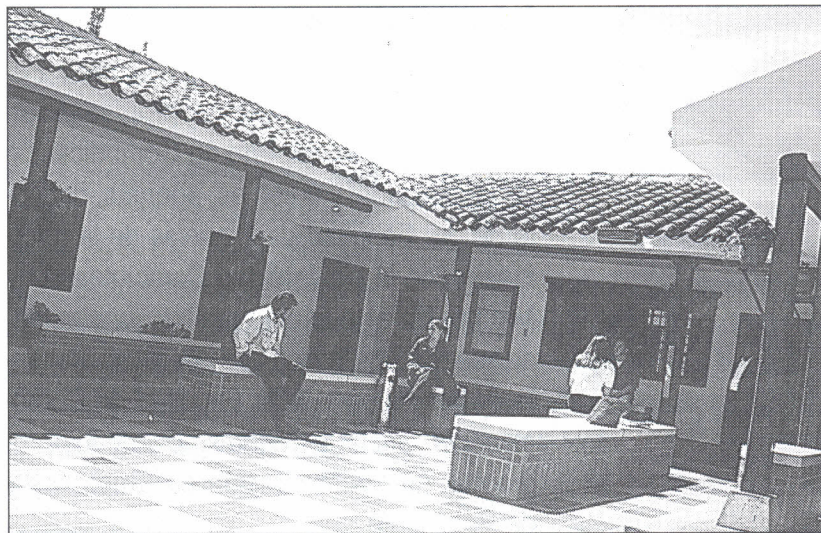
Unisabana, Casa Chía, espera ser un importante centro de apoyo social de los municipios circunvecinos.

La Facultad de Psicología está presente en Unisabana, Casa Chía con el Centro de Atención Psicológica, el desarrollo del programa Cómo lograr el éxito académico y personal , dirigi-