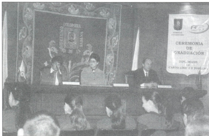
Ceremonia de graduación del Diplomado en Canto Lírico.