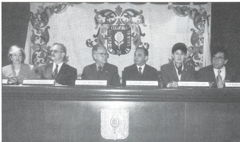
El 30 de enero se realizó en el Auditorio la Apertura del Año Académico.

E l 30 de enero se realizó en el Auditorio de la Universidad, el acto de Apertura del Año Académico 2001, con la presencia de las autoridades académicas, administrativas y un grupo de docentes de la Universidad.