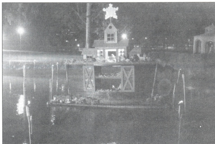
Por su estilo novedoso, el pesebre de la Universidad recibió el premio de la Cámara de Comercio.