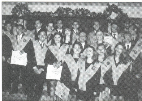
Primer grupo de Médicos de la Universidad.

Con gran satisfacción y después de siete años de estudios, la Universidad realizó en acto solemne la graduación de los primeros 22 profesionales médicos.