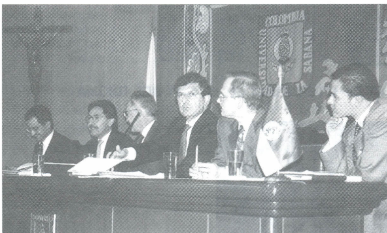
El Referendo y sus implicaciones en el futuro del país, fueron amplios temas de debate durante este encuentro.

E l 27 de abril, el Ministro del Interior, Néstor Humberto Martínez Neira, presentó a un numeroso auditorio, un elocuente discurso sobre la propuesta de Referendo que el gobierno está proponiendo a los colombianos para enfrentar el grave problema de corrupción del país.