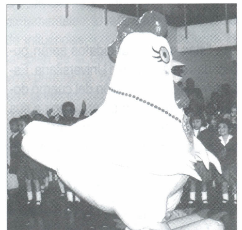
Huevos Santa Reyes divirtió a los niños con su espectáculo.

La organización logística de esta actividad estuvo a cargo del Departamento de Mercado de la Clínica, que continuará realizando actividades culturales y recreativas para la zona de influencia.