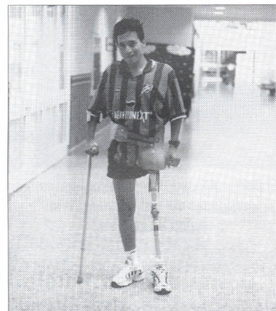
Esta prótesis al ser terminada, tendrá un aspecto natural.

Las prótesis de los miembros inferiores tienen componentes en diseño exoesqueléticos, así como articulaciones y adaptadores para prótesis modulares elaborados en tubos metálicos, forrados en funda espuma para lograr un aspecto natural y aumentar la seguridad de funcionamiento.