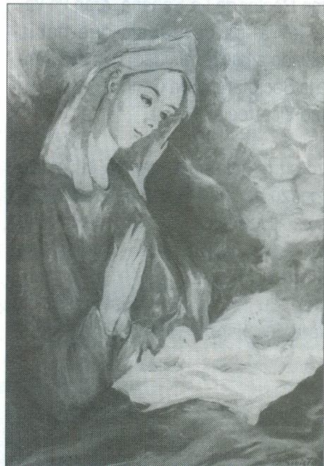
Natividad. Óleo - Blanca Sinisterra. Colección Particular.

No se trata de hacer un recuento exhaustivo de los hitos que han perfilado, en la práctica, la Misión de la Universidad, basta con echar una ojeada al Campus para verlo poblado de nuevos edificios, entre ellos el de la Biblioteca; leer las noticias que dan una visión del crecimiento de la Universidad en el ámbito interno y en el internacional; apreciar