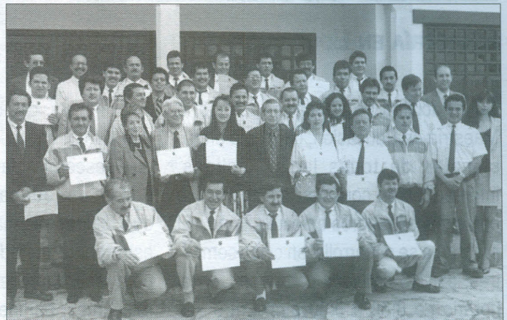
Grupo de conductores de Transportes La Valvanera, el día que recibieron el certificado del curso.