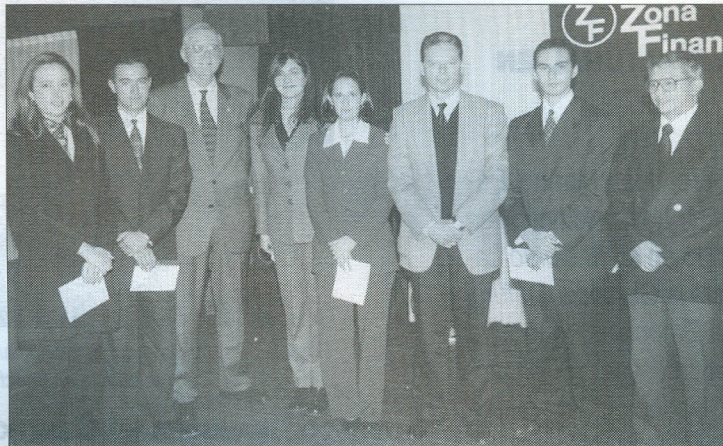
Grupo de alumnos ganadores, acompañados por el Decano y dos profesores de la Facultad.

E n la sede de la Bolsa de Bogotá, el pasado 29 de noviembre, cinco alumnos de VII semestre de Administración de Empresas recibieron $3.000.000 millones de pesos en acciones de la Bolsa al ganar el III Concurso Portafolio de Inversiones, que se desarrolló durante el presente semestre con 500 grupos de estudiantes de universidades de todo el país.