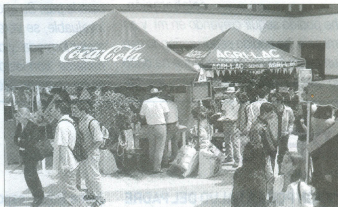
Proyectos con perspectiva empresarial hicieron parte de este evento.

Al final de la jornada, se premiaron los proyectos Reciqua (sistema para reciclar agua de la ducha), Instahot (comida enlatada que se calienta automáticamente); Portaplex (camas desarmables); Biotec (ladrillos hechos de material reciclado); Mascotasalud (EPS para animales); Colombian Quality (sistema para el manejo y transporte de cajas); UV vestidos de baño (para bronceado total).