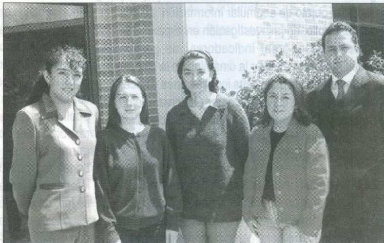
Algunos de los estudiantes de la Facultad de Derecho de 8° y 10° semestre, participantes en el IV Congreso Iberoamericano de Derecho Empresarial.

Las investigaciones tituladas "¿Pasivos laborales?: ¡recursos financieros frescos!"; "¿Son convenientes las alianzas estratégicas?" y "¿Es posible una banca de fomento que respete las leyes del mercado?", y cuyos autores son estudiantes de octavo y décimo semestre, fueron las más comentadas entre los asistentes, quienes esperaban fueran las ganadoras. Al final y en contra de lo que se esperaba, el jurado decidió premiar la ponencia "¿Pasivos laborales?: ¡recursos