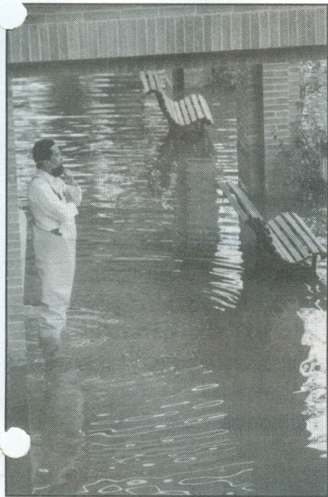
El esfuerzo de los directivos, profesores y alumnos fue definitivo para superar la emergencia.

En las últimas semanas, el equipo de funcionarios del Inalde, puso a prueba su capacidad de actuar con independencia en situaciones imprevistas, como la que enfrentaron con la inundación reciente de sus instalaciones, debido al fuerte invierno que afecta la sabana de Bogotá.