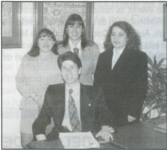
Equipo de trabajo de Financiación Universitaria.