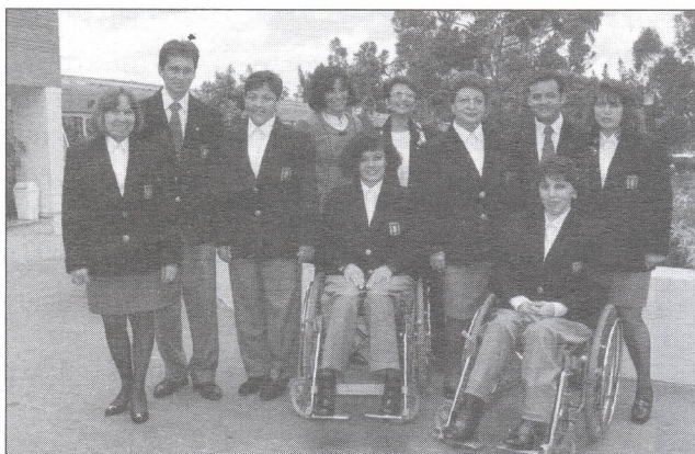
Equipo humano a cargo de los procesos administrativos, del Centro Nacional de Rehabilitación

Es muy importante la prevención mediante la aplicación de la BCG a niños menores de un mes.