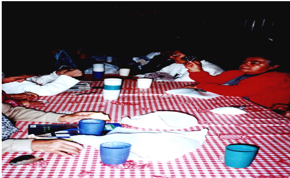
Socialización del trabajo realizado