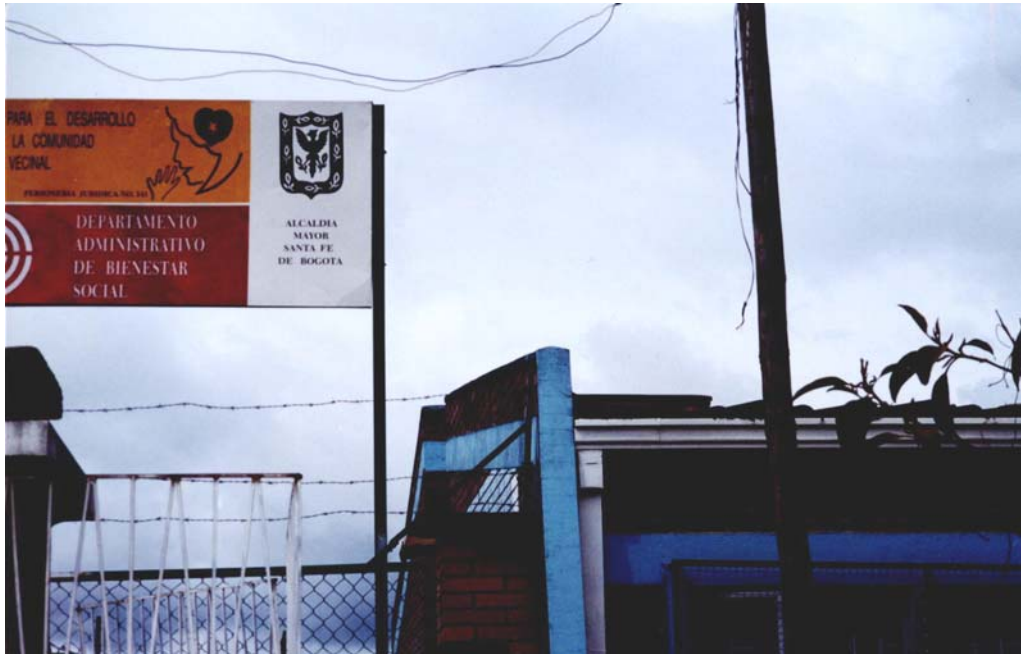
Fachada casa vecinal Barrio Barlovento.