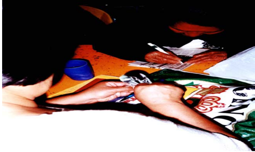
Personas de la tercera edad realizando los primeros trazos de repujado