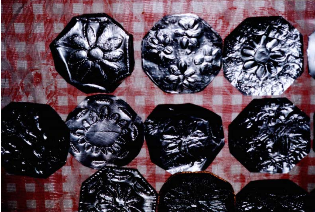
Socialización, diferentes tipos de repujado en lamina.