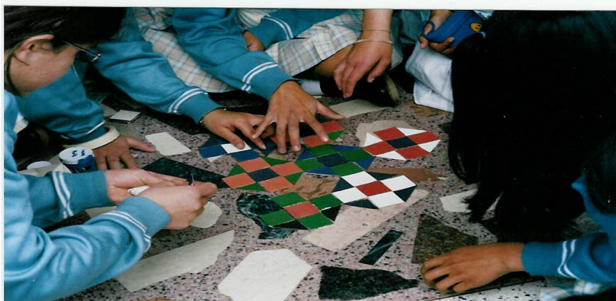
Grupo de niñas del grado séptimo, 12 años