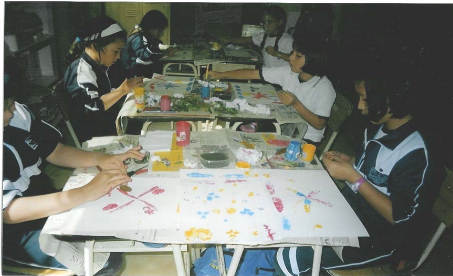
Niñas de sexto desarrollando el trabajo de pintura