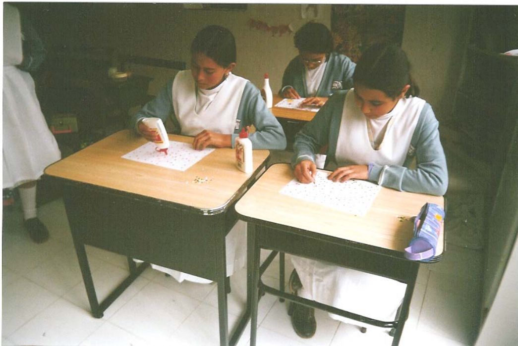
Niñas de sexto, 11 años

Con esta actividad se pretende dar a conocer la importancia del punto como elemento visual de la imagen, porque conociendo sus características y cualidades, se pueden construir imágenes que se captan mejor para comunicarse de forma eficaz con los demás. Este elemento se puede imaginar en la mente y se percibe cuando se le asigna características como textura, forma tamaño o color.