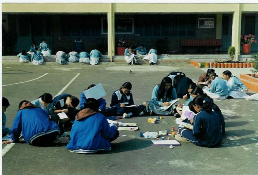
Trabajo con pintura, grado séptimo 12 años