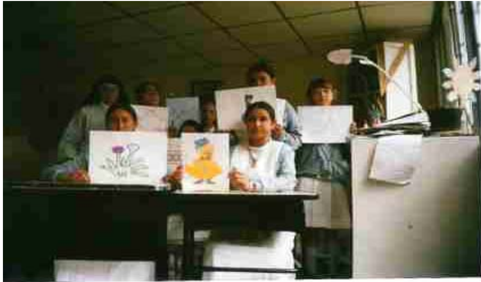
Exposición de trabajos, grado sexto