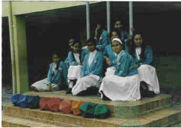
Niñas Grado séptimo. 12 años

Recursos Físicos: Escuadras y reglas, lápices 2H y 6B Papel y Cartón paja, cintas adhesivas, bisturí, pegante, vinilos y pinceles planos.