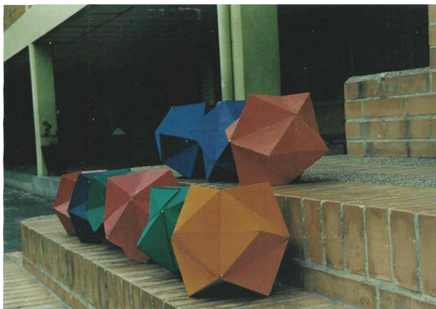
Trabajo realizado por las alumnas de séptimo