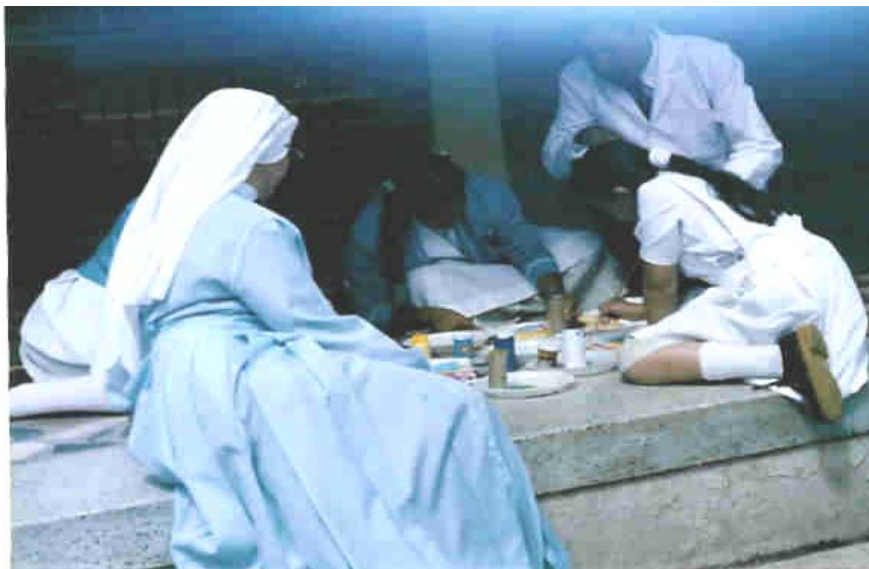
Trabajo con las niñas del grado séptimo, 12 y 13 años