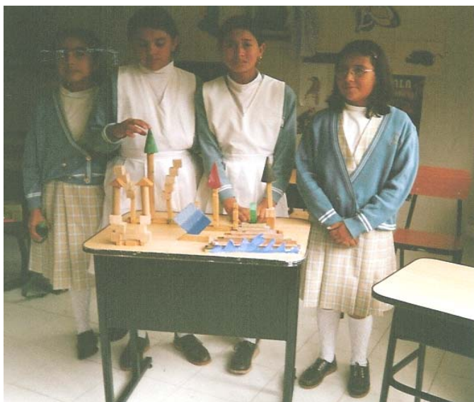
Alumnas del grado sexto exponiendo sus trabajos

Recursos Humanos: Estudiantes, Educadores