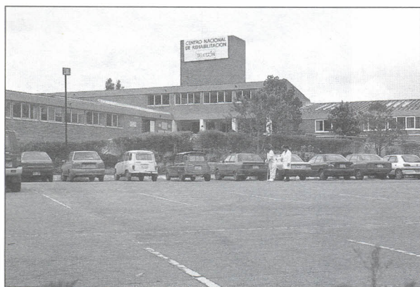
El Centro Nacional de Rehabilitación busca responder a las necesidades de sus usuarios

Debido a la gran demanda de consulta de odontología, el Centro Nacional de Rehabilitación – Teletón amplió el horario de atención al público a los días martes, miércoles, jueves y viernes. Además, inició la consulta de odontopediatría los días martes en horas de la tarde.