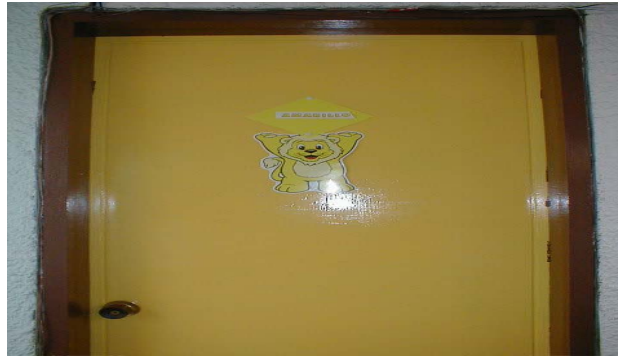
FOTO # 16 Entrada al salón del Taller Amarillo en el Centro Infantil Blanco y Negro.

Cuando los niños entran al primer nivel de preescolar se tiene en cuenta su adaptación y por eso hay un período dedicado a este proceso.