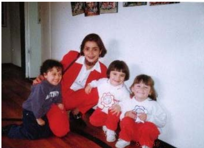
FOTO # 15 Niñas del grupo Conejito Verde , con su profesora en Periquito.