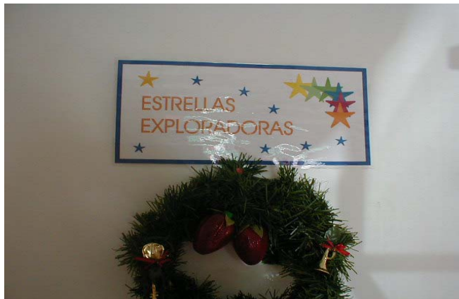
FOTO # 4 Entrada al salón del grupo Estrellas Exploradoras en el Centro Creciendo Juntos.