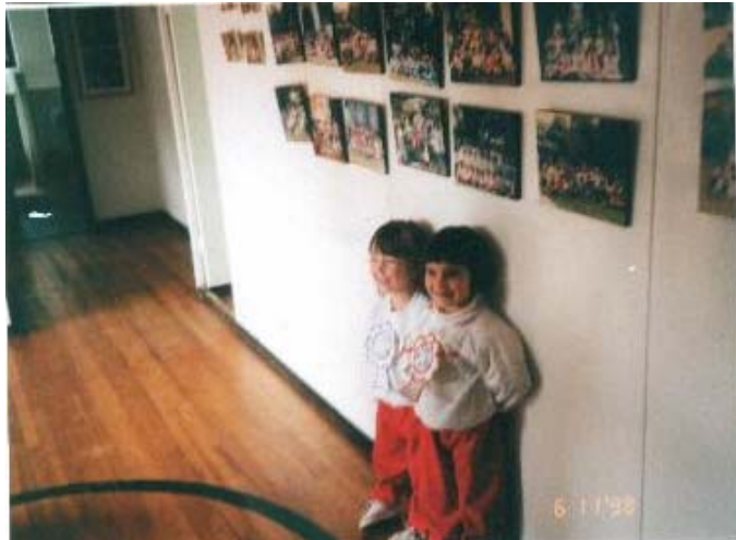
FOTO #14 Dos niñas en el Jardín Periquito, pertenecientes al curso Conejito Verde , luego de la primera Izada de Bandera del año.

En el primer nivel del Jardín hay niños de aproximadamente un año y medio. No se contempla la necesidad de un programa para la adaptación del niño.