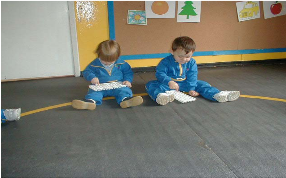
FOTO # 10 Grupo de niños de Estrellas Exploradoras durante su primera actividad del día en el Creciendo Juntos.