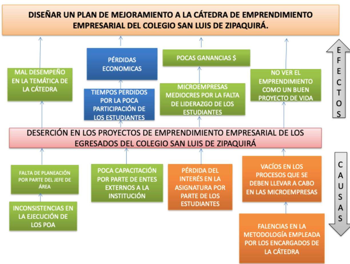
Anexo 1. Instrumento diagnóstico (árbol del problema).