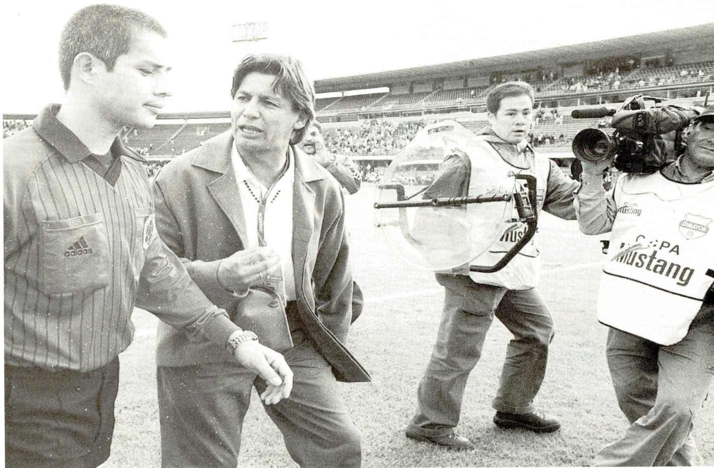
La prensa deportiva no se limita solo a mirar o a registrar, en ocasiones interviene directamente, perdiendo su norte y adoptando posiciones beligerantes similares a las de los deportistas. Sin embargo, el periodista deportivo colombiano goza de buen prestigio internacional.