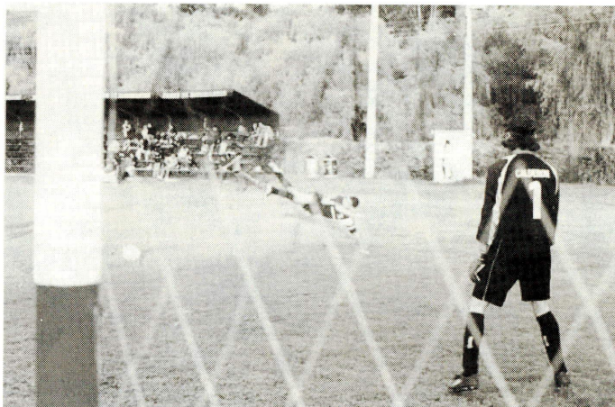
Canchas de fútbol, tenis, baloncesto, entre otras, hacen parte del gigantesco proyecto que se adelantará el próximo semestre.