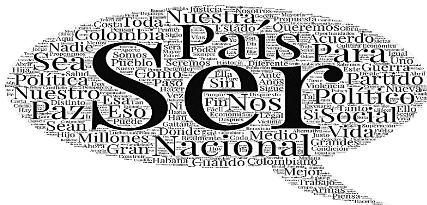
Imagen 2. Nube de palabras, análisis cuantitativo del discurso. Elaboración propia.

La palabra todos se encuentra en las categorías “visión de Colombia” (subcategorías: Colombia como consecuencia de su presente y Colombia en prospectiva), “visión sobre el partido político de las Farc” (subcategorías: partido solución y partido víctima) y “visión sobre el proceso de paz”. La palabra político se encuentra en las categorías “visión de Colombia” (subcategorías: Colombia como consecuencia de su pasado y Colombia en prospectiva), “visión sobre el partido político de las Farc” (subcategoría: partido solución) y “visión sobre el proceso de paz”. Por último, la palabra partido se encuentra en las categorías “visión sobre el partido político de las Farc” (subcategoría: partido solución) y “visión sobre el proceso de paz”.