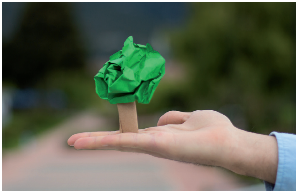
Cada uno de los estudiantes tiene como responsabilidad reciclar y hacer de La Sabana un campus sostenible.

Hoy, La Sabana cuenta con 53 puntos ecológicos que están constituidos por un juego de tres canecas. Cada una tiene una calcomanía que contiene información