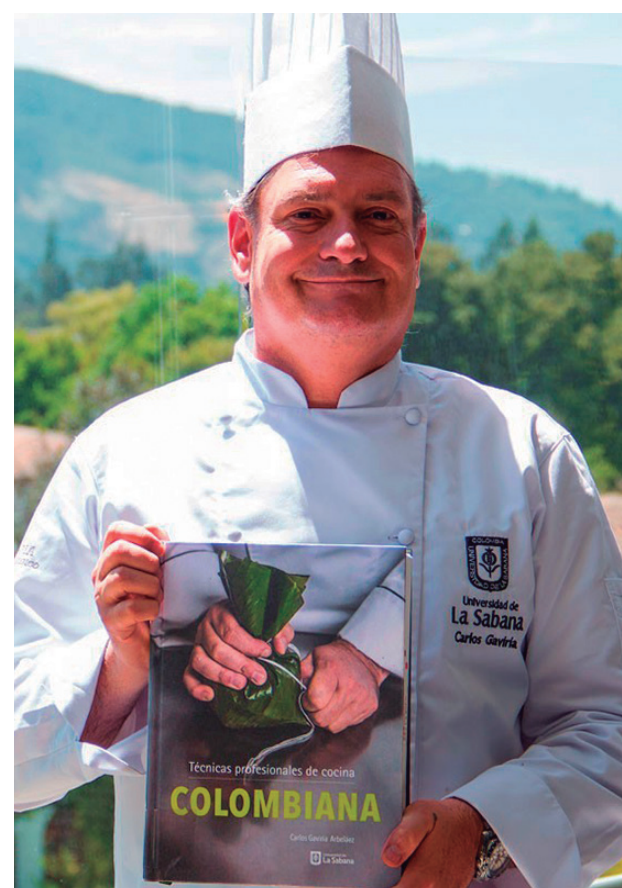
Carlos Gaviria Arbeláez, autor de Técnicas profesionales de cocina colombiana , el mejor del mundo en los Gourmand World Cookbook Awards 2017)

chef Gaviria, para demostrar cómo y qué tanto su obra ha impactado en el país. Este galardón es un homenaje a la cocina colombiana, una guía permanente para estudiantes, profesores, profesionales y amantes de nuestra gastronomía.