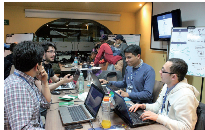
La actividad contó con la participación de 128 estudiantes de diferentes universidades de Bogotá, Cali y Medellín. Ellos recibieron la asesoría de 41 mentores de La Sabana durante las 30 horas que duró el evento.