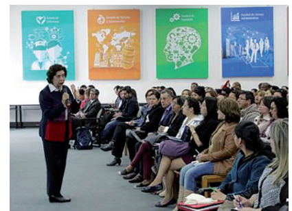
La jornada contó, además, con la exposición de experiencias significativas en prácticas de evaluación caracterizadas en el 2016.

Este encuentro se dio en el marco de una investigación que se adelanta sobre la evaluación en todos los colegios de Bogotá, liderada por el Instituto para la Investigación y el Desarrollo Pedagógico (IDEP).