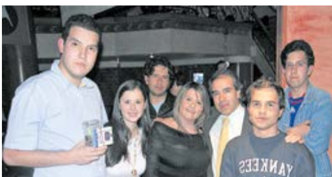
En 2006 En Directo recibió el Premio a la Excelencia.