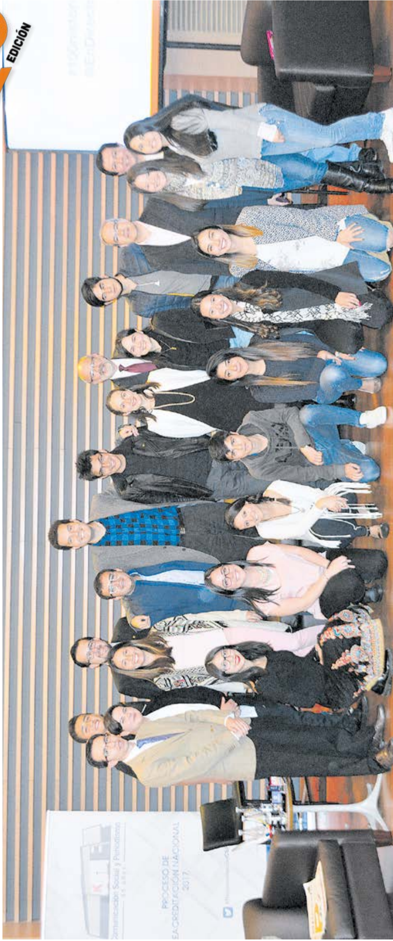
La foto del reencuentro

Para celebrar la llegada de la edición número 100 de En Directo , la Facultad de Comunicación invitó a un grupo de reporteros que, en su paso como estudiantes, ejercieron como editores y reporteros de este periódico. Esta es la foto del grupo.