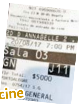
Entrada a cine