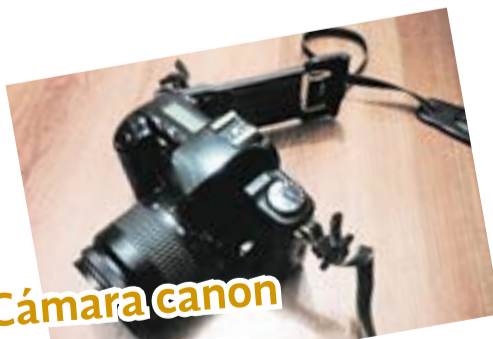
Cámara canon ad1 program