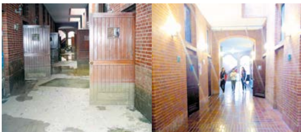
2011 Interior del edificio G 2017