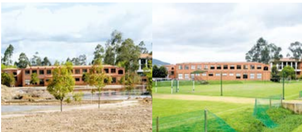
2011 Edificio G 2017