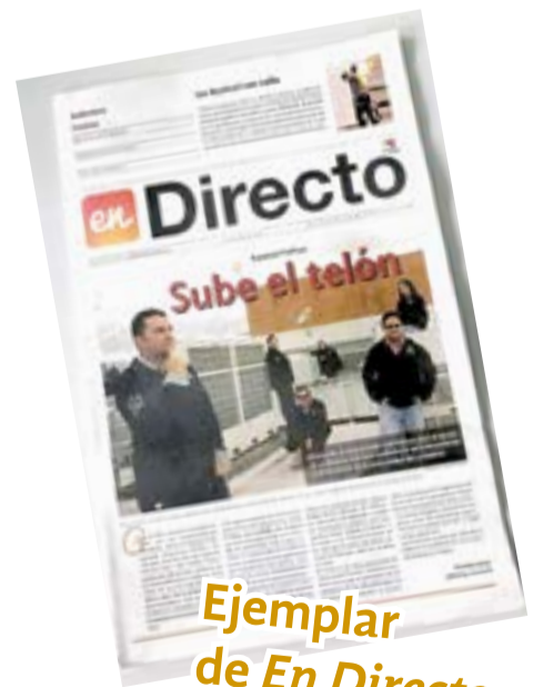
Ejemplar de En Directo