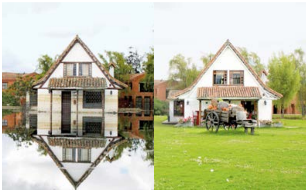
2011 La casita del lago 2017