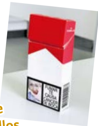
Caja de cigarrillos