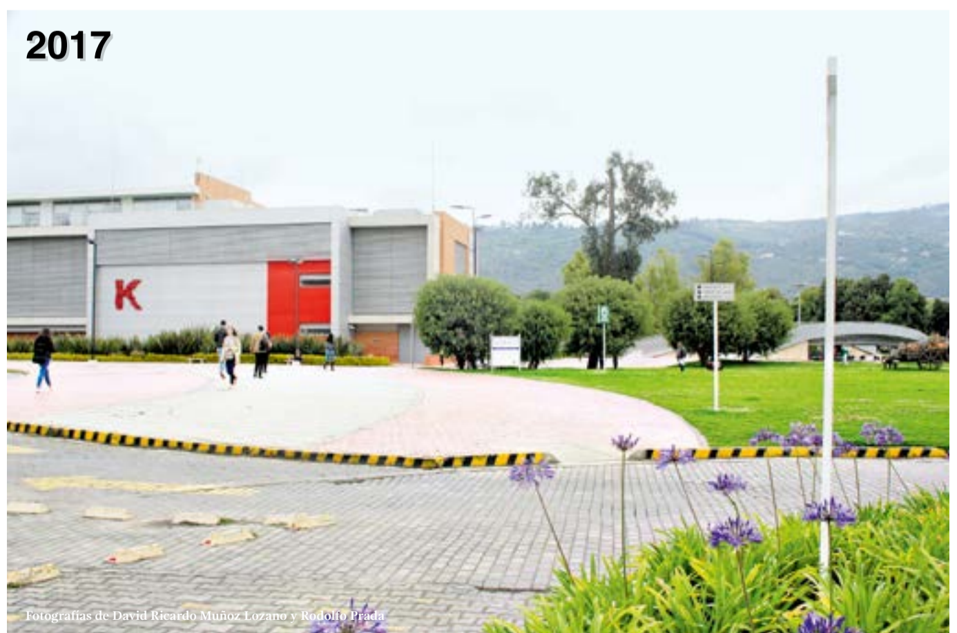
Edificio K, sede de la Facultad de Comunicación de la Universidad de La Sabana.