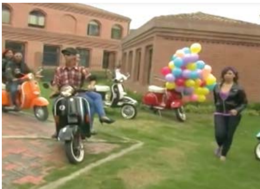
Más de 200 personas hicieron parte de la producción y realización del lipdub.