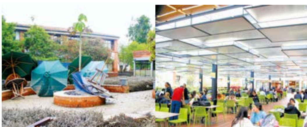
2011 Restaurante el embarcadero 2017