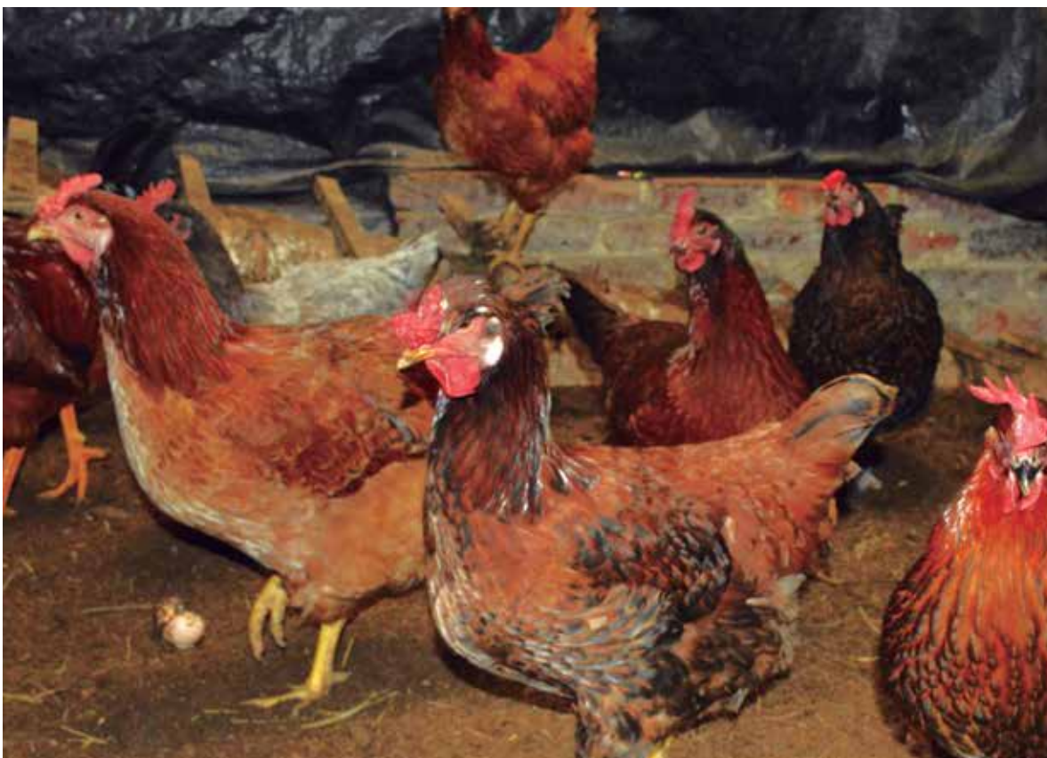
La limpieza del gallinero reduce la probabilidad de incubación de huevos de mosca.