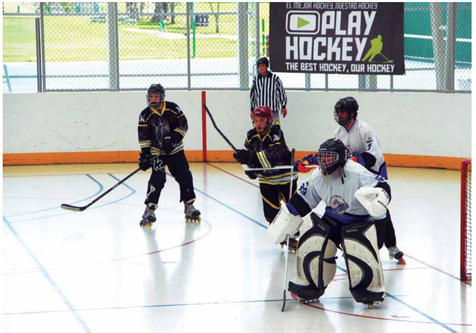
■ PlayHockey organiza 'festivales' de fines de semana para mantener activo el deporte.