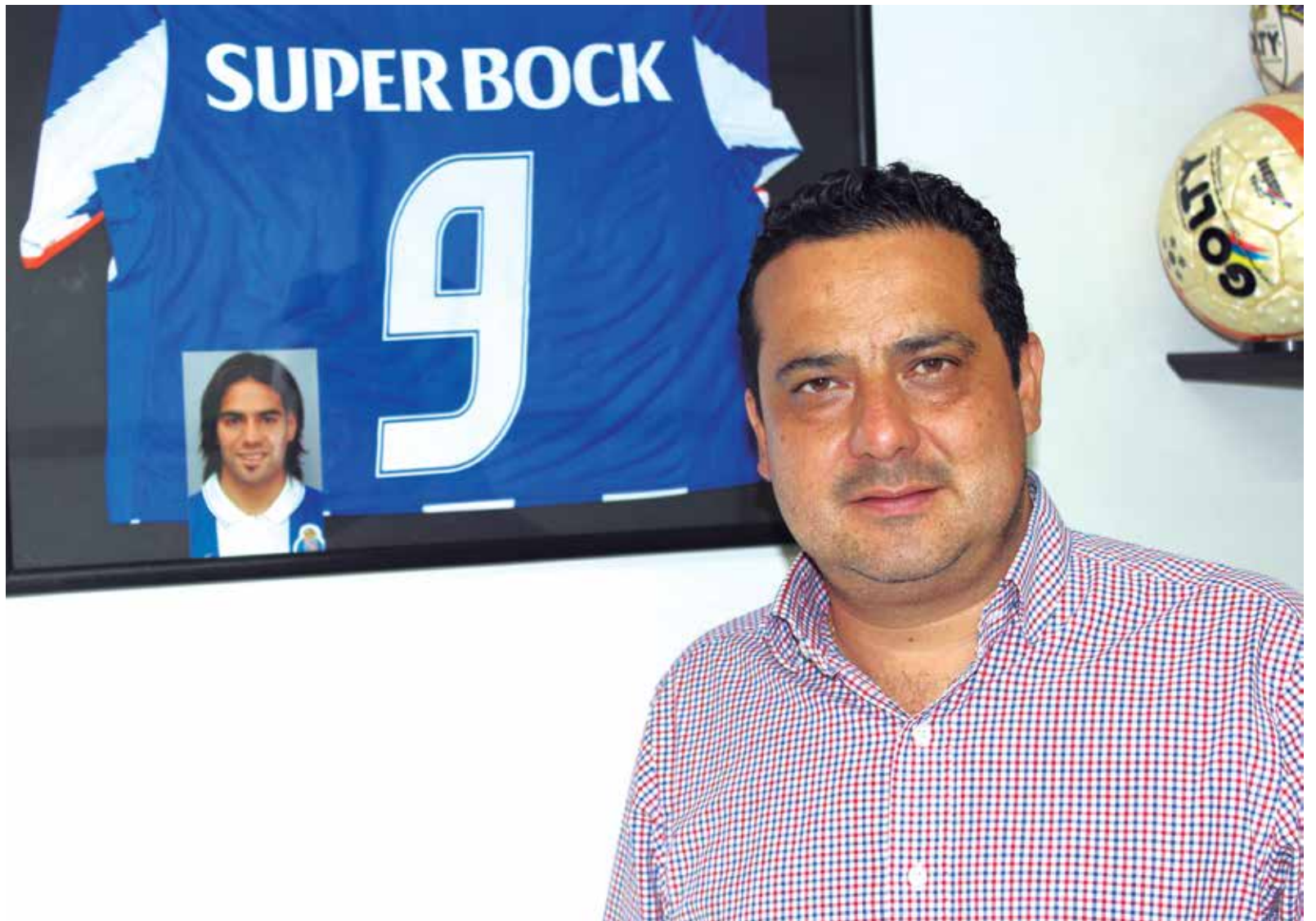
El cuerpo médico viaja a los torneos con más implementos que la misma utilizaría del equipo.

Sí, nosotros vemos también todos los partidos y analizamos