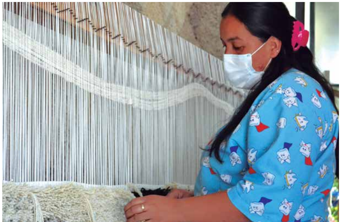
La lana virgen está cada vez más escasa, pues la lana sintética está empezando a ocupar su lugar