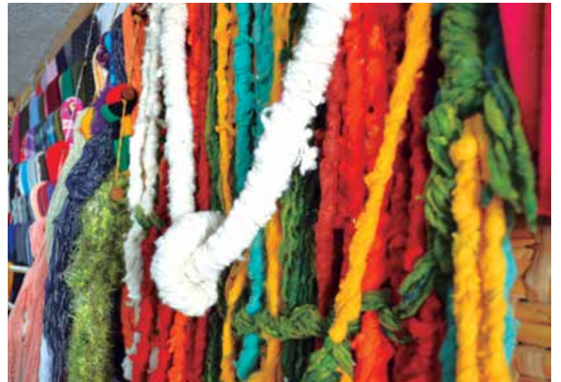
Los tejedores de tapetes han tenido que buscar nuevas alternativas, pues cada vez son menos los productores de lana colombiana.

En Colombia, es más rentable invertir en lana importada, pues es casi un 40 por ciento más económica que la nacional, según Cristina Rodríguez, vendedora de lanas y artículos de costura. Una madeja de lana sencilla con marca colombiana, de 100 gramos, está costando