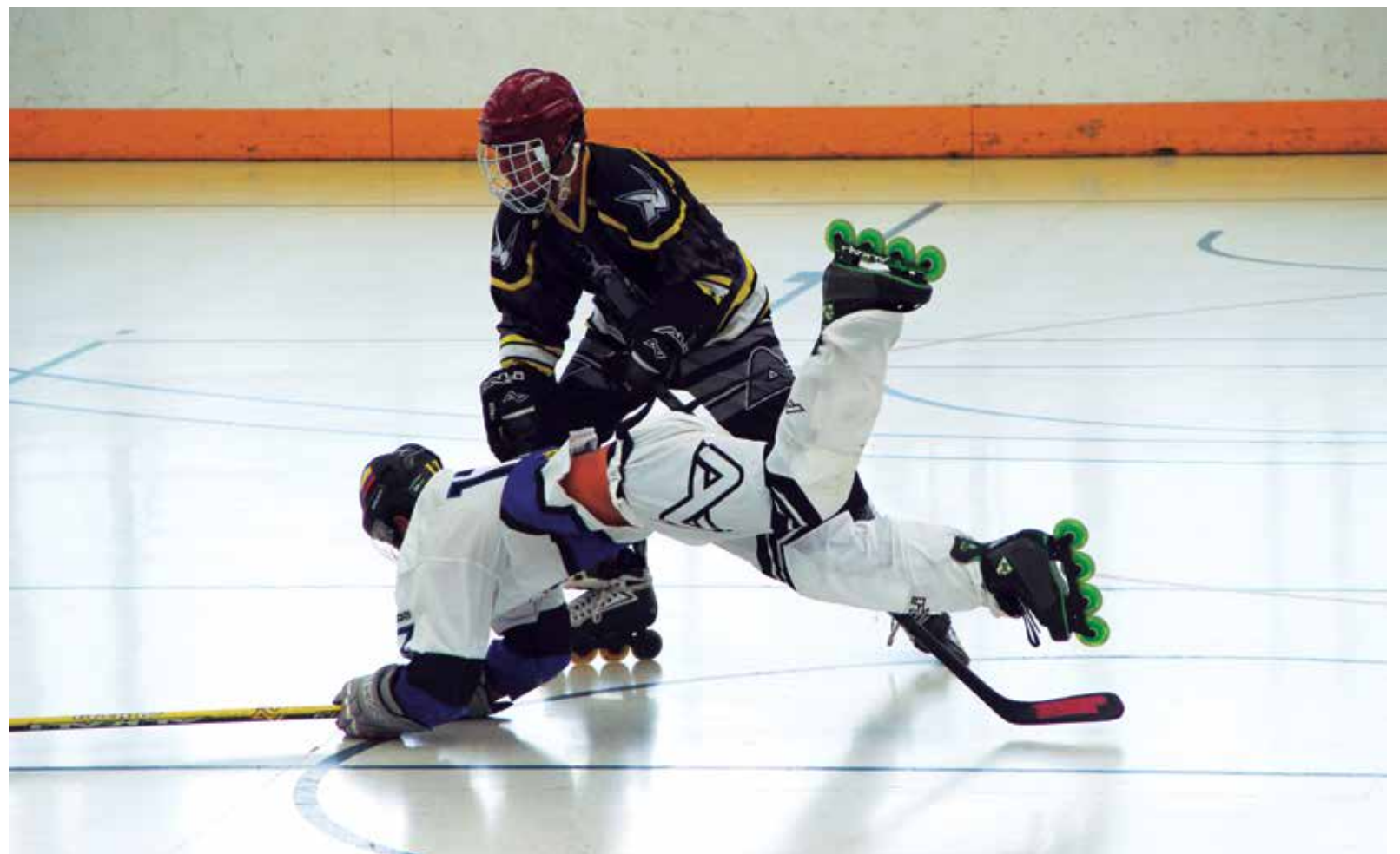
■ El club privado de hockey, Rhinos Napal, entrena todas las noches en el colegio Los Nogales, de Bogotá.