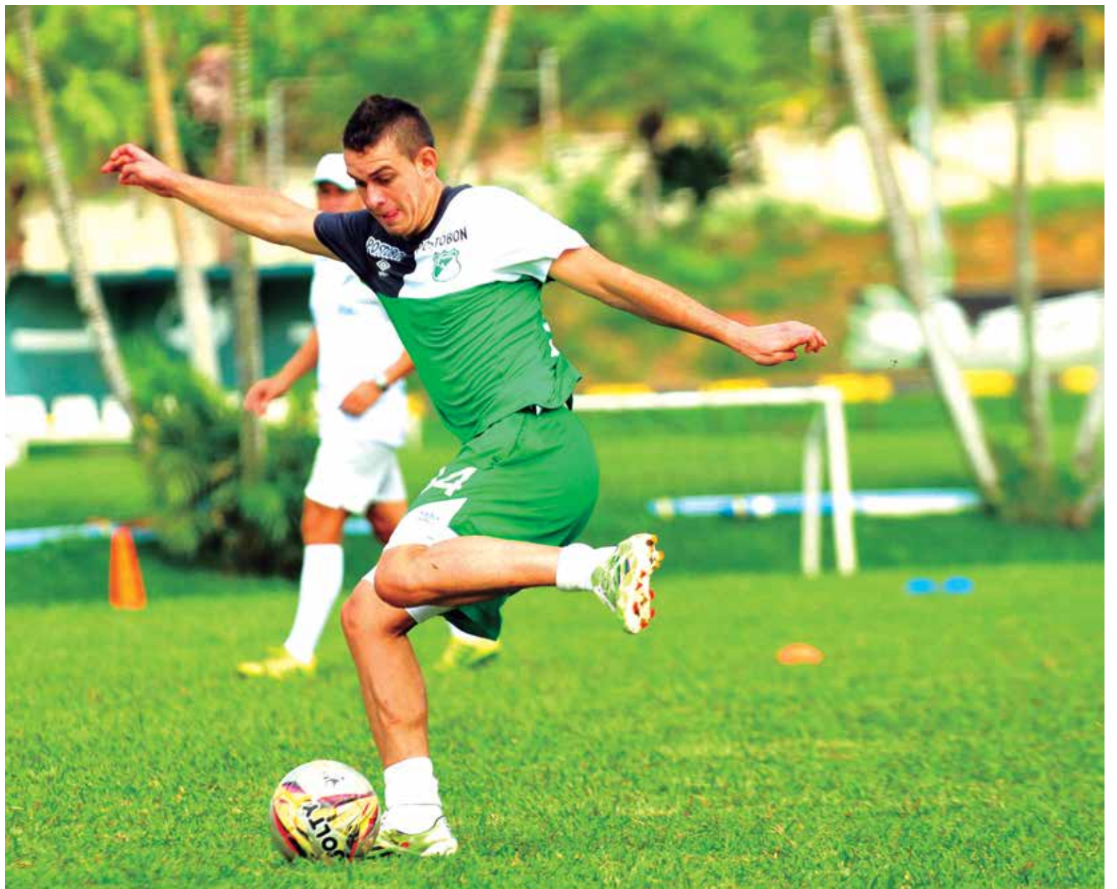
El delantero del Cali en la Sub 20.

sabe que jugarán partidos de preparación. En Chile, el profe’ hará unos trabajos de fútbol para que el equipo se acople y atienda los requerimientos del técnico.