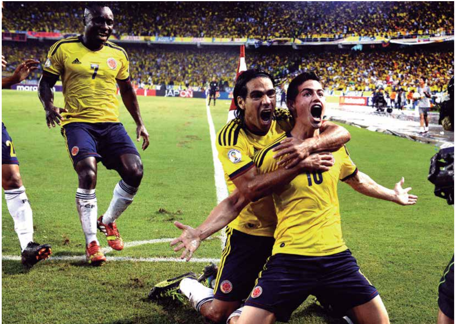
■ James Rodríguez y Falcao García liderarán la Selección en la Copa América.

En la zona de volantes, descartados Abel Aguilar y Freddy Guarín, se debe confiar