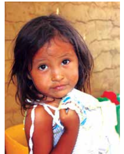
■ Niños wayuu luchan por su vida ante la falta de acceso a servicios públicos.