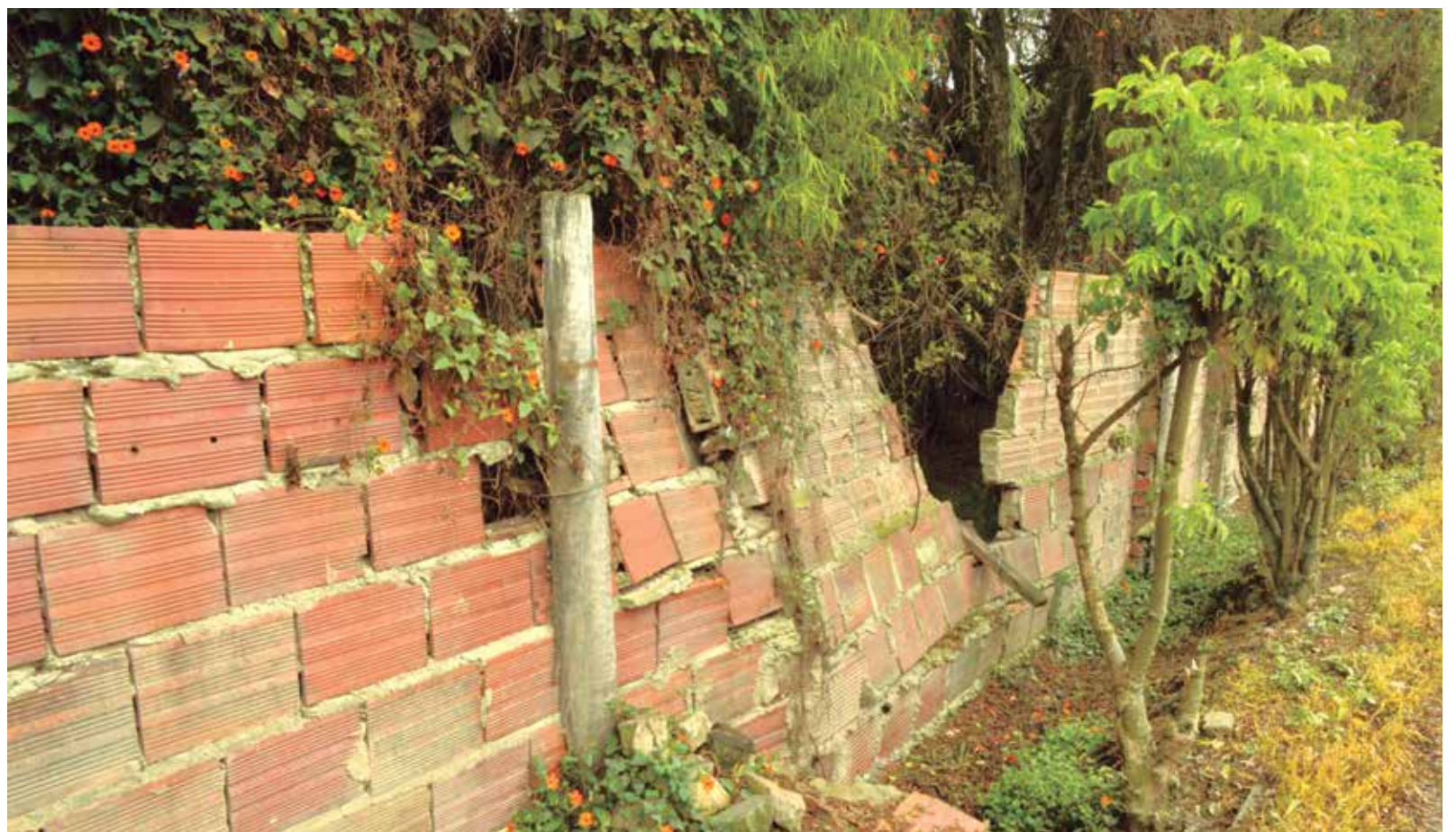
■ Muro que rodea las 4,7 hectáreas de la granja Bacatá en la Vereda Fonquetá. / FOTO: María José Velasco.

El ICA ha hecho un seguimiento desde 2014 a los inconvenientes generados por las avícolas, de acuerdo con Renzo Molano, líder del proyecto aviar de la seccional Cundinamarca. “El