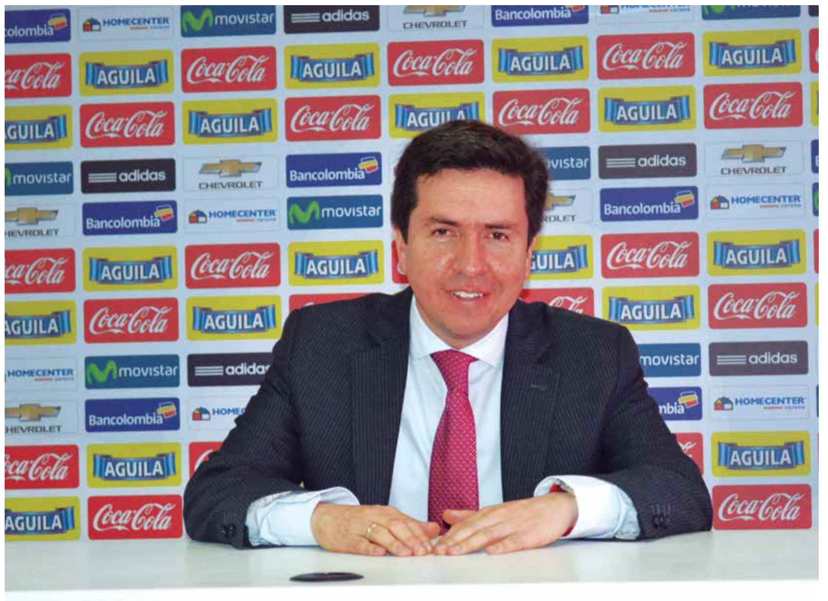
Directivos de la FCF se han reunido en Barranquilla para ver los terrenos de la nueva sede deportiva de la Selección.

Hoy más que nunca, estamos preparados para una Copa América. Se tienen la logística, la infraestructura y el conocimiento de la gente, que es algo importantísimo. Para nosotros, la realización de Mundial Sub 20 de 2011 fue el punto de partida más grande de todo este cambio que ha tenido el fútbol colombiano. Siempre hablamos mucho de Pékerman, pero él es una consecuencia de muchas de las cosas que hemos (FCF) venido haciendo. Así que Colombia perfectamente podría optar por otra Copa América.