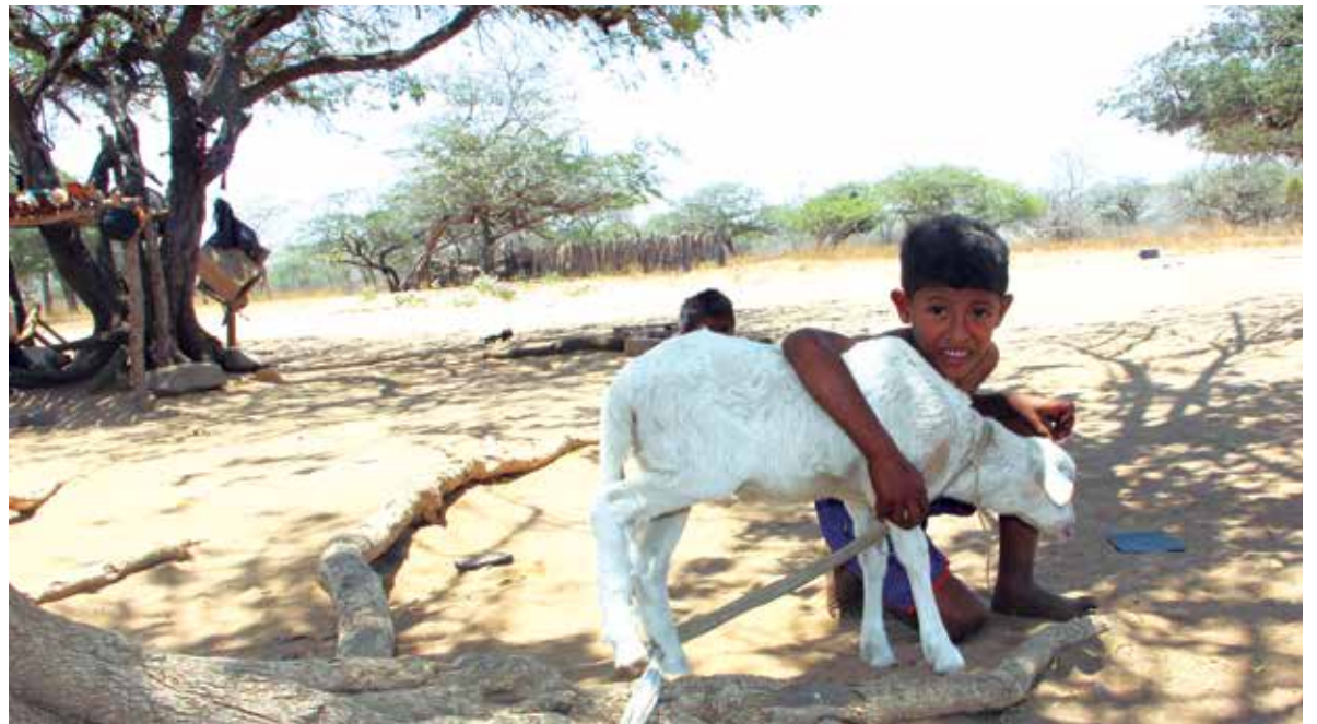
■ Por cada cuatro niños, menores de cinco años, que fallecen por desnutrición, un anciano también muere.

Los Wayuu se muestran a la expectativa de que las autoridades y el resto del país recuerden su existencia y se vuelquen en su ayuda.