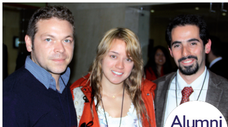
■ Algunos de los graduados que asistieron al encuentro.