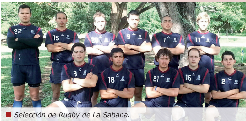
■ Selección de Rugby de La Sabana.