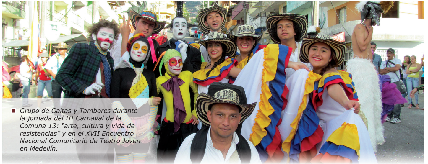
■ Grupo de Gaitas y Tambores durante la jornada del III Carnaval de la Comuna 13: "arte, cultura y vida de resistencias" y en el XVII Encuentro Nacional Comunitario de Teatro Joven en Medellín.

El 3 y 4 de noviembre el grupo de Gaitas y Tambores de la Universidad, con apoyo de Bienestar Universitario y el Fondo de Estudiantes, participó en el III Carnaval de la Comuna 13: "arte, cultura y vida de resistencias", y en el XVII Encuentro Nacional Comunitario de Teatro Joven, que se realiza todos los años en Medellín (Antioquia).