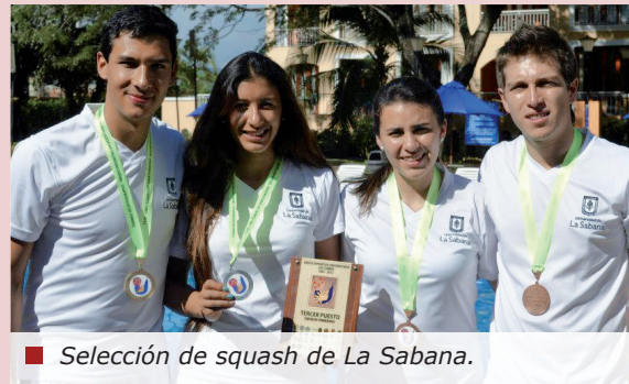
■ Selección de squash de La Sabana.

Del 29 de octubre al 2 de noviembre, en Girardot, se llevaron a cabo las finales del grupo deportivo universitario Los Cerros, evento que reunió alrededor de dos mil deportistas representantes de 33 universidades de Bogotá.