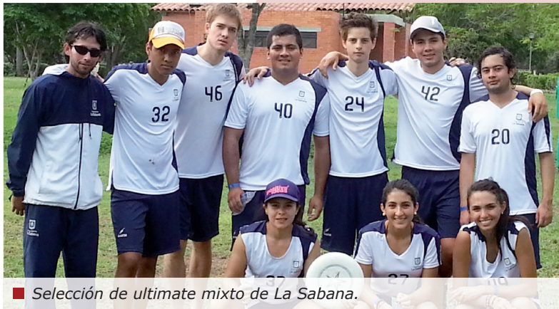
■ Selección de ultimate mixto de La Sabana.