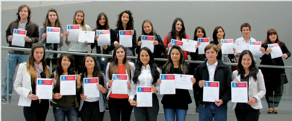
Alumnos distinguidos de la Facultad de Comunicación 2012-1.

La Dirección de Estudiantes realizó el 27 de septiembre la ceremonia de alumnos distinguidos de la Facultad de Comunicación, en la que fueron premiados veinte alumnos de Comunicación Social y de Comunicación Audiovisual, quienes obtuvieron los mejores promedios académicos de la Facultad y han demostrado un alto espíritu de colaboración y servicio. A continuación los ganadores: