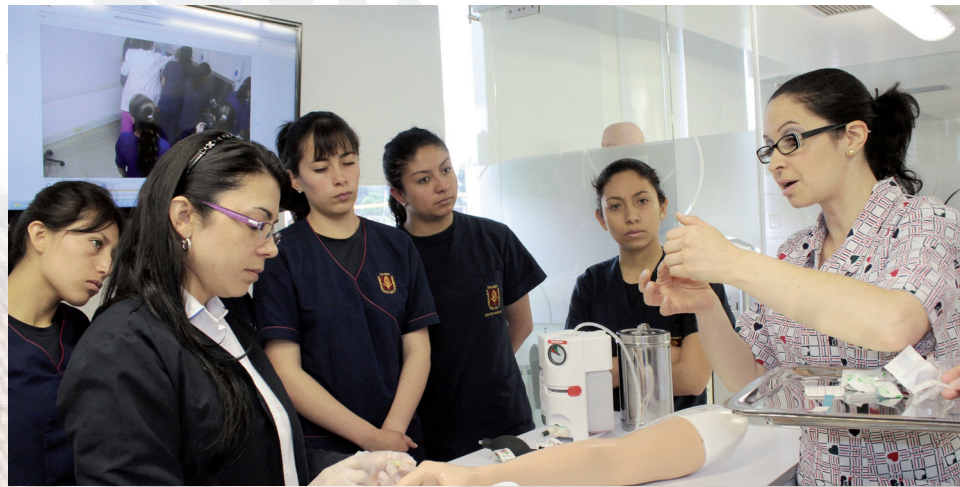
■ Estudiantes de Enfermería durante una práctica en el Laboratorio de Simulación.