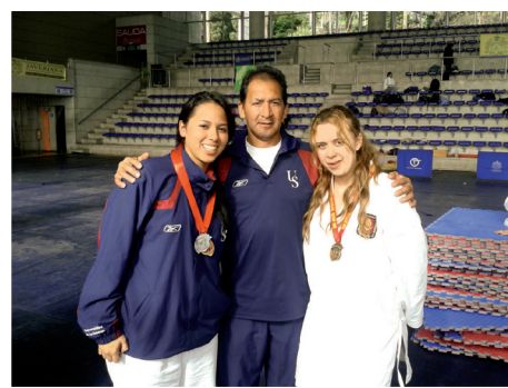
■ Equipo de Karate-do de La Sabana.

Del 16 al 21 de octubre las selecciones de Natación, Tenis de Campo, Tenis de Mesa y Karate Do de la Universidad nos representarán en los Juegos Universitarios Nacionales 2012, que se realizarán en Cartagena.