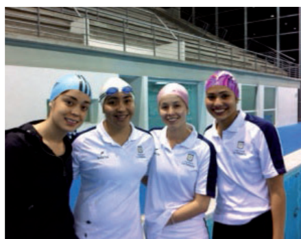
■ Equipo de Natación Femenino de la Universidad de La Sabana.