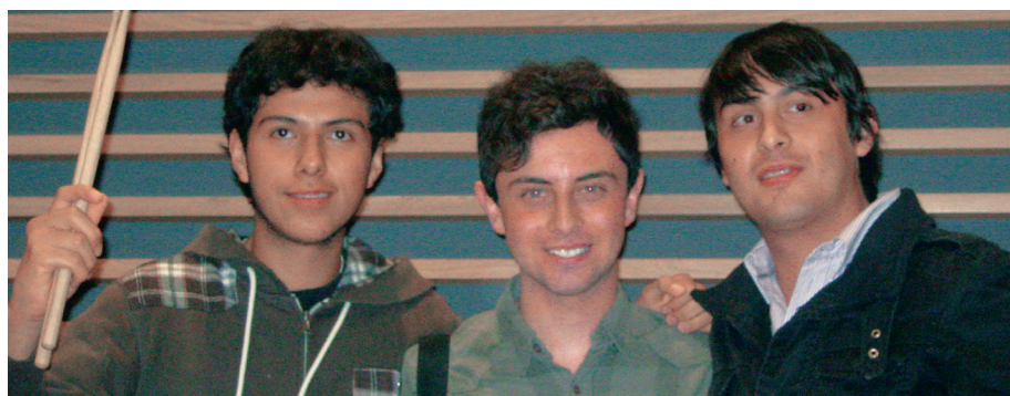
■ Grupo “Amaurosis”, conformado por estudiantes de cuarto a sexto semestre de Medicina.

Para participar pueden inscribirse enviando sus datos a: <colifeplus@live.com>.