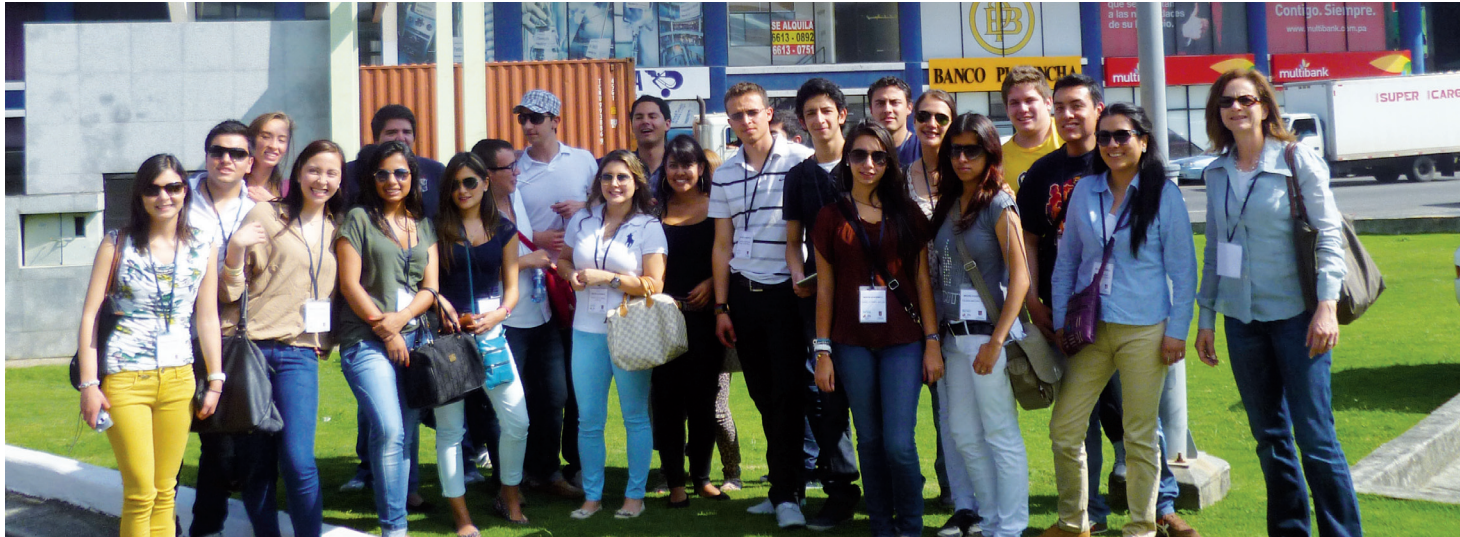
■ Delegación de La Sabana que estuvo en la Misión Panamá.

Del 18 al 23 de septiembre, veinticinco estudiantes y dos profesores participaron de la Misión Académica a Panamá. La delegación estuvo conformada por estudiantes de Ingeniería Industrial, Administración de Negocios Internacionales, de Empresas, de Instituciones de Servicio y de Mercadeo y Logística internacionales.