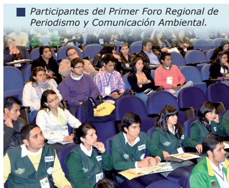
Participantes del Primer Foro Regional de Periodismo y Comunicación Ambiental.

El 10 de septiembre se llevó a cabo el Primer Foro Regional de Periodismo y Comunicación Ambiental. Evento que tuvo lugar en las instalaciones de la Universidad de La Sabana, con el objetivo de consolidar una red de periodistas que apoyen y acompañen el proceso socio-ambiental que se viene adelantando en Chía.