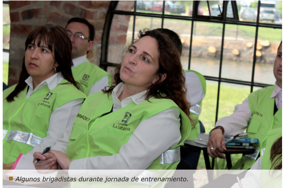
Algunos brigadistas durante jornada de entrenamiento.

Verónica Vásquez <veronicavasro@unisabana.edu.co> - Bienestar Empleados