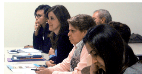
Asistentes al encuentro con directivos y docentes de centros de práctica de la Licenciatura en Pedagogía Infantil

La Coordinación de Prácticas de la Licenciatura en Pedagogía Infantil de la Facultad de Educación convocó el martes 28 de agosto a un encuentro con directivos y docentes de los centros de prácticas con los que el Programa tiene convenio.