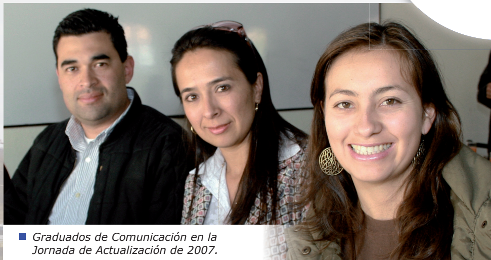
■ Graduados de Comunicación en la Jornada de Actualización de 2007.

En la próxima Jornada de Actualización Académica para estudiantes de últimos semestres, graduados de pregrado y postgrado de la Facultad de Comunicación, se presentará la nueva Maestría en Comunicación Estratégica y se tratará este tema en las intervenciones.