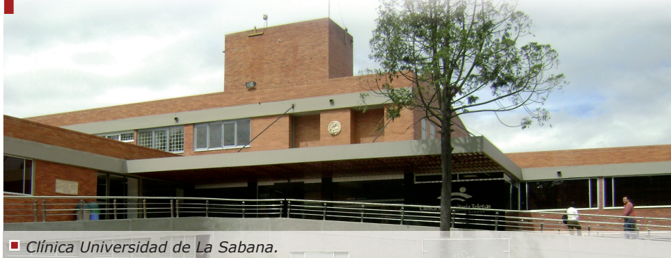
Clínica Universidad de La Sabana.

La Iglesia Católica dice al respecto: “El trasplante de órganos es moralmente aceptable con el consentimiento del donante y sin riesgos excesivos para él. Para el noble acto de la donación de órganos después de la muerte, hay que contar con la plena certeza de la muerte real del donante” (Catecismo 2296).