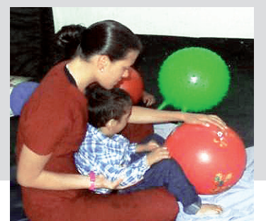
■ Estudiante de Fisioterapia durante brigada social

Para el desarrollo de la actividad se desplazaron en compañía del Ejército Nacional hasta la zona, donde realizaron una actividad social y de apoyo en educación en salud.