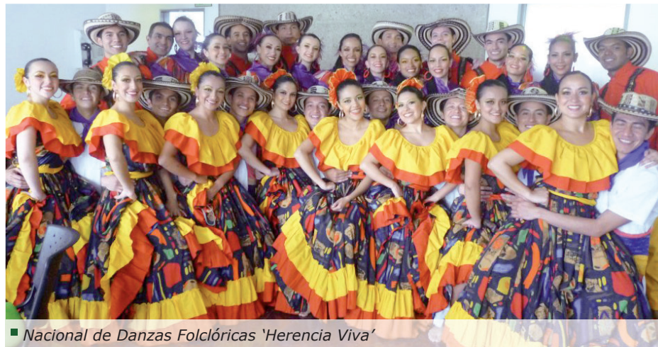
Nacional de Danzas Folclóricas ‘Herencia Viva’

El artículo puede ser leído en la página web del Boletín, una de las pocas revistas latinoamericanas de derecho indexadas en Scopus : http://biblio.juridicas.unam.mx/revista/DerechoComparado/