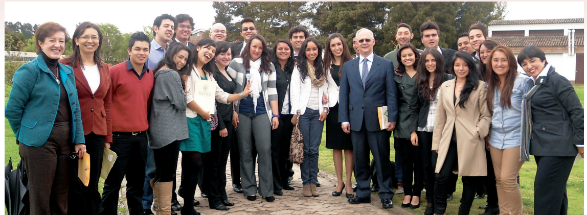
El Rector en compañía de algunos directivos y los integrantes del Coro.