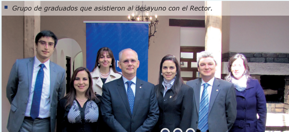
■ Grupo de graduados que asistieron al desayuno con el Rector.

Los tres graduados coincidieron en que los estudios que realizaron en la Universidad de La Sabana les aportaron a su desarrollo personal y profesional, principalmente por la formación humanística que recibieron.